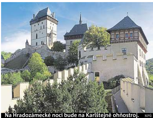
Na Hradozámecké noci bude na Karlštejně ohňostroj.