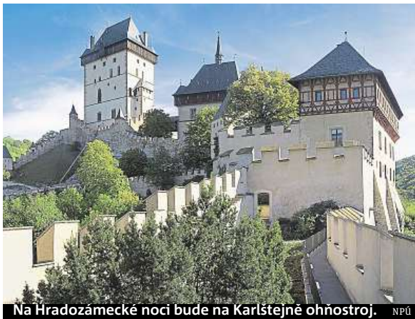
Na Hradozámecké noci bude na Karlštejně ohňostroj. NPÚ

30. 7. Ora Pro Nobis s Oldřichem Janotou – koncert vokální akustické kapely www.hrad-krakovec.cz