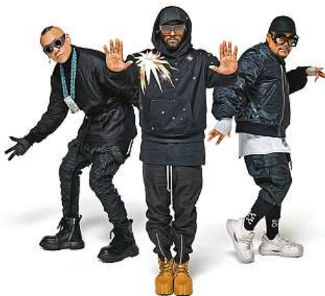
Současnými členy kapely The Black Eyed Peas jsou Taboo (vlevo), will.i.am (uprostřed) a Apl.de.ap.

Skupina za více než 25 let své kariéry získala šest cen Grammy a prodala 35 milionů alb. Do Prahy přiveze začátkem prázdnin svou nezměnitelnou energii. Lístky na koncert pro šest tisíc lidí jsou již v prodeji. „Očekáváme velký zájem, proto doporučujeme zajistit si vstupenky co nejdříve,“ vzkazují fanouškům pořadatelé.