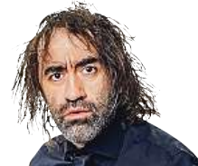
JAKUB KOHÁK ŠUP DO BOTĚČKY

Když jsem takto počastoval celou družinu, přijel král. Měl ženské šaty a v puse kytičku, což má historické opodstatnění! Jízda králů vznikla na základě skutečné události, kdy po porážce u Bílovic prchal král Matyáš Korvín před Jiříkem z Poděbrad směrem k Uhrám, a aby nebyl odhalen, byl oblečen do dívčích šatů, a aby nebyl lapen kvůli mužskému hlasu, nesměl ani promluvit – proto ta kytička. Mnoho místních bylo v krojích, vyprávěli mi různé příhody a celé to bylo moc pěkné. Když jsem odcházel, dojel mě ještě jeden legrůt s žádostí o příspěvek: „Jízda králů sa koná v moderním módu – prispět môžete aj pomocí kjú ár kódu!“