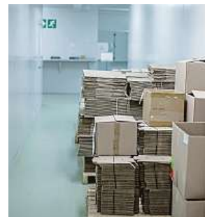
Kromě recyklace existují další využití obalů.