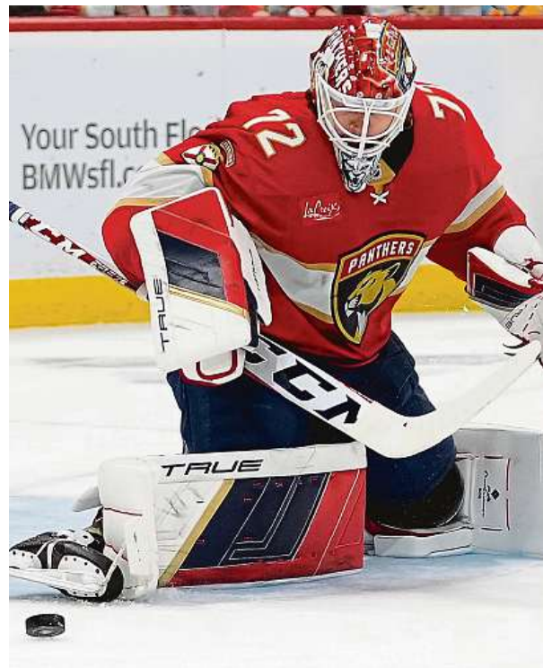
Útočník Edmontonu Connor McDavid (v popředí) předčil útočnou hvězdu Dallasu Start Roopa Hintze, když v šestém duelu finále Západní konference zaznamenal gól a přihrávku. Podaří se mu ve finále Stanley Cupu vyvrát i na floridského brankáře Sergeje Bobrovského?