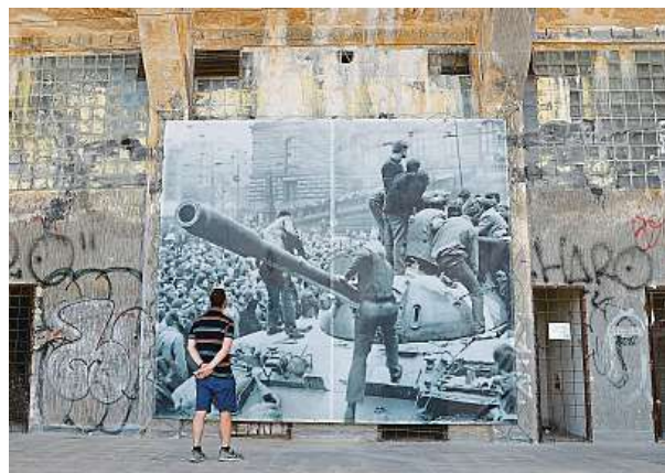
Jedna z loňských expozic pod záštitou Paměti národa

Zástupci Paměti národa ukázali na to, že vzpomínky na druhou světovou válku mizí spolu s tím, jak odchází generace, která zažila nacistickou okupaci, válečné utrpení na frontách, v koncentračních táborech a zvěznicích. Jejich vzpomínky ale zůstávají. Paměť národa ve zvukových nahrávkách i videích uchovává svědectví více než