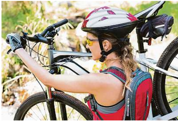
Při jízdě na kole je důležité dodržovat pravidla. Například helma by měla být standardem.