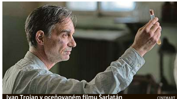
Ivan Trojan v oceňovaném filmu Šarlatán

Vrchní soud začátkem dubna toto rozhodnutí z formálních důvodů zrušil. Podle AKA se tak však stalo, aniž by