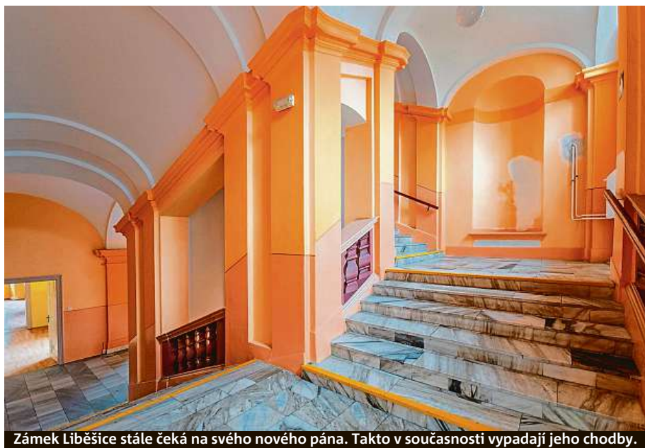
Zámek Liběšice stále čeká na svého nového pána. Taktó v současnosti vypadají jeho chodby.

Pro další příklad nemusí chodit daleko. Sám ho jako makléř nabízí. Bývalá továrna Elias Palme dodávala lustry do celého světa. Třeba i do milánské opery La Scala. V současnosti je sklárna v Kamenickém Šenově spíše jen „horký brambor“. MAH