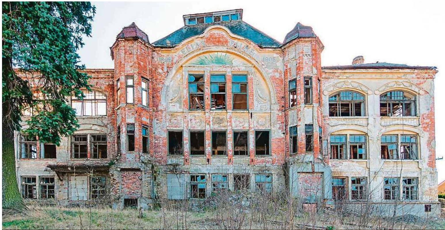
Bývala tu sklárna. Nyní objekt nemá skoro žádná okna v pořádku.