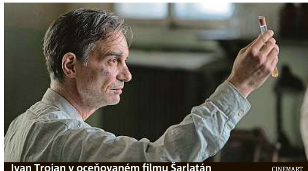
Ivan Trojan v oceňovaném filmu Šarlatán

Vrchní soud začátkem dubna toto rozhodnutí z formálních důvodů zrušil. Podle AKA se tak však stalo, aniž by