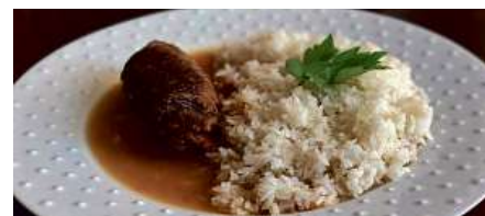
ŠPANĚLSKÝ PTÁČEK s klobásou, okurkou, slaninou, cibulí