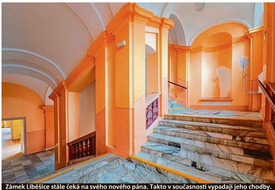
Zámek Liběšice stále čeká na svého nového pána. Takto v současnosti vypadají jeho chodby.

Pro další příklad nemusí chodit daleko. Sám ho jako makléř nabízí. Bývalá továrna Elias Palme dodávala lustry do celého světa. Třeba i do milánské opery La Scala. V současnosti je sklárna v Kamenickém Šenově spíše jen „horký brambor“. MAH