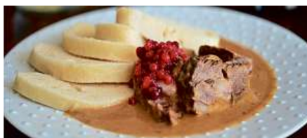
HOVĚZÍ SVÍČKOVÁ na smetaně, karlovarský knedlík