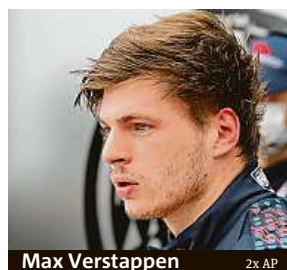
Max Verstappen

hrál, Hamilton dojel v úzkých uličkách Monte Carla až sedmý a stěžoval si jak na technické nedostatky, tak špatně zvolenou strategii. „Je třeba si to probrat za zavřenými dveřmi,“ nechal se slyšet. Před závodem v Ázerbájdžánu si čistil hlavu i seskokem