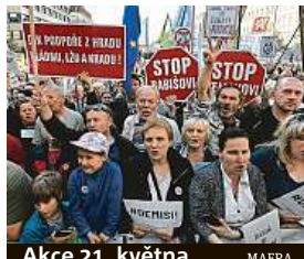
Akce 21. května MAFRA

jmenoval poté, co přišly první zprávy o tom, že Babiš je ve střetu zájmů.