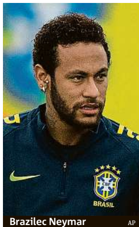
Brazilec Neymar