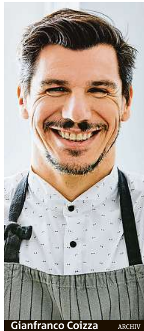
Gianfranco Cozza ARCHIV

Je toho spousta, mezi nejdůležitější a nejbližší významné milníky patří: snídaňová nabídka z kvalitních a prověřených potravin od našich dodavatelů či prodloužení otevírací doby až do 21.30 hodin od pondělí do pátku. Dále pak rozšíření nápojového/vinného lístku, přidání středomořského aperitiva, tapas do menu a degustační večere.