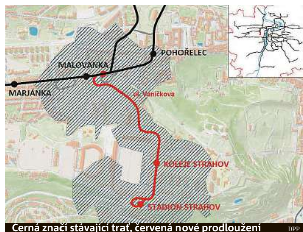
Cerná značí stávající trať, červená nové prodloužení DPP

Dopravní podnik zahájí přípravy na výstavbu tratě z Malovanky ke kampusům.