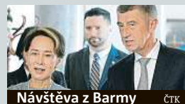
Návštěva z Barmy

Premiér Andrej Babiš včera přijal barmskou vůdkyni Su Tjij. Nositelka Nobelovy ceny za mír a někdejší disidentka v Praze otevře barmskou ambasádu. Myanmar se významně rozvíjí a Češi toho chtějí využít. V 70. a 80. letech tam díky ČSSR vznikaly kalužárny, pivovary a další továrny. A na to chce Česko podle premiéra navázat. Na tamní trh chce proniknout s firmou Škoda a dalšími firmami.