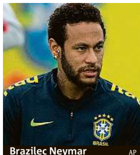
Brazilec Neymar