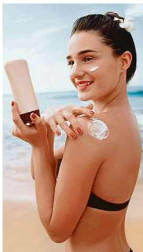
Mažte se krémem

„Kůži je vhodné si prohlížet jednou měsíčně. Pokud se pigmentové znaménko začne měnit, tedy svědit, zvětšovat, krvácet a podobně, je třeba vyhledat dermatologa. Při prohlídce si všímáme symetrie, ohraničení, barvy, průměru. Nebo si všímáme takového znaménka, které se liší od ostatních – říká se tomu příznak „oškřivého káčátka“. Pokud má člověk znamének mnoho, na kontroly sám nestačí – je třeba je zdokumentovat elektronicky, celotělovou fotografií, digitálně je vyhodnotit, digitálním dermatoskopem,“ popisuje správný přístup ke kontrole znamének prof. MUDr.