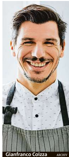
Gianfranco Cozza ARCHIV

Je toho spousta, mezi nejdůležitější a nejbližší významné milníky patří: snídaně a nabídka z kvalitních a prověřených potravin od našich dodavatelů či prodloužení otevírací doby až do 21.30 hodin od pondělí do pátku. Dále pak rozšíření nápojového/vinného lístku, přidání středomořského aperitiva, tapas do menu a degustační večere.