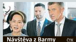
Návštěva z Barmy

Premiér Andrej Babiš včera přijal barmskou vůdkyni Su Tjij. Nositelka Nobelovy ceny za mír a někdejší disidentka v Praze otevře barmskou ambasádu. Myanmar se významně rozvíjí a Češi toho chtějí využít. V 70. a 80. letech tam díky ČSSR vznikaly kalužárny, pivovary a další továrny. A na to chce Česko podle premiéra navázat. Na tamní trh chce proniknout s firmou Škoda a dalšími firmami.