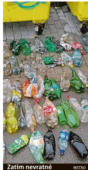
Zatím nevratné METRO

Do žlutých kontejnerů míří asi čtyřicet nejruznějších druhů plastů, většina se na další recyklaci využít nedá.