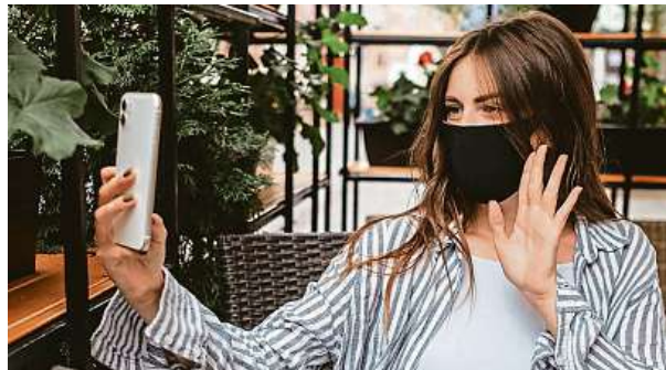
Zhává novinka zatím vychází na velké peníze.

Němečtí vědci propojili chytrý telefon s detekcí zánětu spojivek.