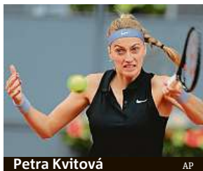
Petra Kvitová

Tenistka Petra Kvitová se stala první čtvrtfinalistkou antukového turnaje v Madridu. Trojnásobná šampionka v osmi finále porazila Rusku Veroniku Kuděrmětovovou po setech 6:3, 4:6 a 6:4. „Jsem na sebe velice pyšná, každý set rozhodl jeden brejk. Byl to skvělý zápas,“ řekla Kvitová. ČTK