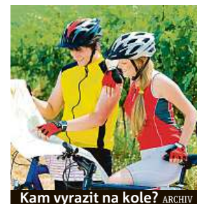
Kam vyrazit na kole?