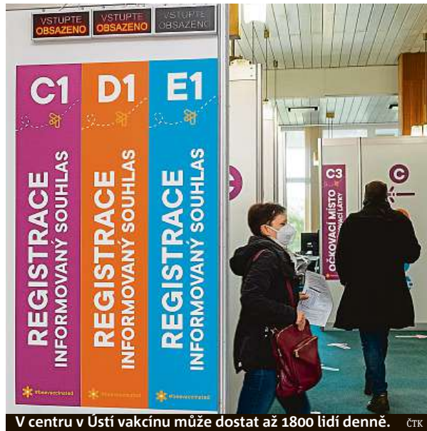
V centru v Ústí vakcínu může dostat až 1800 lidí denně.

Očkování zatím jde pomaleji, než se plánovalo. Exministr zdravotnictví Jan Blatný prohlásoval, že v dubnu se dostane tempo vakcinace nad sto tisíc podaných dávek denně. Dosavadním maximem je 77 181 dávek z posledního dubnového čtvrtka. V pracovní dny obvykle dostalo některou dávku očkování kolem 60 tisíc lidí, o víkendech kolem 20 tisíc. Zlepšení by mohlo nastat po otevření dalších větších očkovacích center (viz box). Obě dávky vakcíny dostalo již přes milion lidí, aspoň první dávku necelých 2,2 milionu zájemců. MET