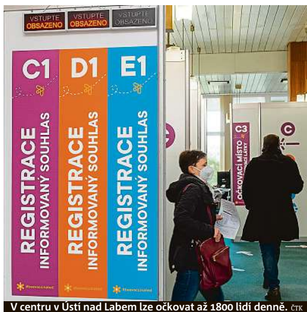
V centru v Ústí nad Labem lze očkovat až 1800 lidí denně.

Očkování zatím jde pomaleji, než se plánovalo. Exministr zdravotnictví Jan Blatný