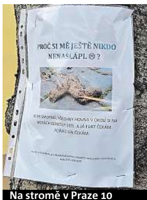
Na stromě v Praze 10