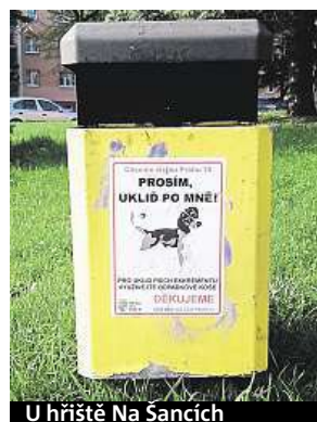
U hřiště Na Šancích