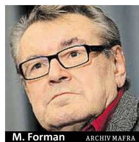
M. Forman ARCHIV MAFRA