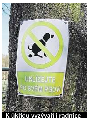
K úklidu vyzývají i radnice