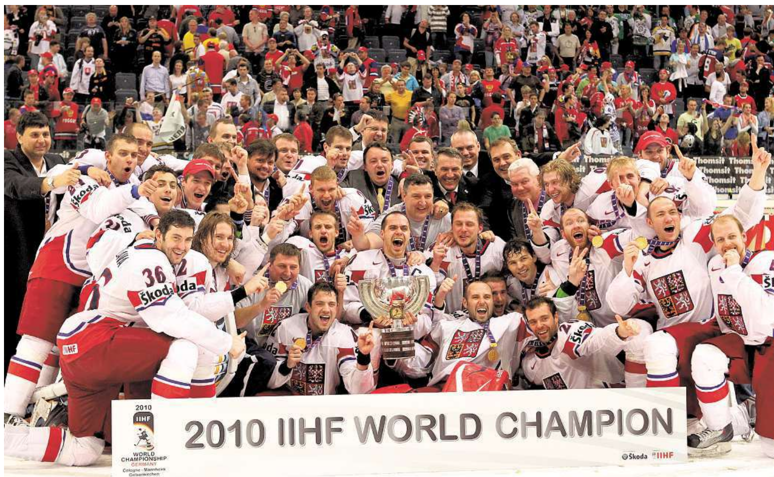
Čeští hokejoví reprezentanti se naposledy stali mistry světa v roce 2010 v Německu. Ve finálovém zápase v Kolíně nad Rýnem tehdy porazili Rusko 2:1.