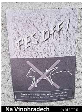
Na Vinohradech 5x METRO

Úklid po psech z rozpočtu Prahy odčerpává miliony korun ročně. Pokutování ze strany strážníků však proti provinilcům nepomáhá. Maximální taxa deset tisíc korun totiž mohou udělit jen tehdy, když psa s pánem chytí při činu. Strážníci proto ročně rozdají jen pár stovek těchto pokut. „Nedovedu si představit člověka, který po psovi neuklídí, když vidí strážníka,“ uvedla před časem pro iDNES.cz jejich mluvčí Irena Seifertová. JAR