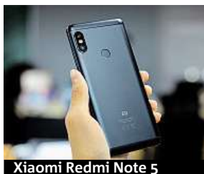
Xiaomi Redmi Note 5

Své uživatele nadchne vysokým výkonem osmijádrového procesoru Qualcomm Snapdragon 636, který si hravě poradí i s těmi nejnáročnějšími aplikacemi a hrami současnosti. Ohromnou výhodou je i operační paměť o velikosti 4 GB, jež má hlavní zásluhu na tom, že celá uživatelská nadstavba operačního systému Android 7.1, MIUI 9 šla-