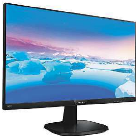
Philips 243V7QJABF za bezkonkurenční cenu 2x MIRONET

covém monitoru zaujme, jsou jeho elegantní křivky s tenkými rámečky kolem displeje, které nejen dobře vypadají, ale zároveň plní praktickou funkci v případě, že používáte více monitorů vedle sebe. Osazený LCD panel je typu IPS (In-Plane-Switching) s rozlišením 1920 x 1080 pixelů, takže můžete vaše oči pomalu začít připravovat na mimořádně živé barvy, jemně vykreslené detaily a široké pozorovací úhly až 178°. Philips nezklame ani rychlostí odezvy, která činí slušných 5 ms. Monitor rovněž disponuje celou řadou ochranných funkcí, z nichž jsou nejzásadnější