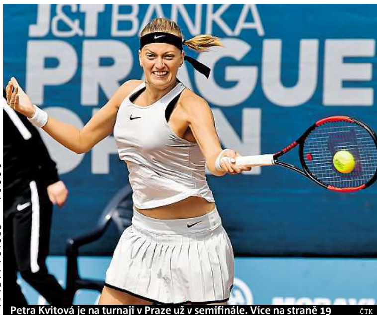
Petra Kvitová je na turnaji v Praze už v semifinále. Více na straně 19