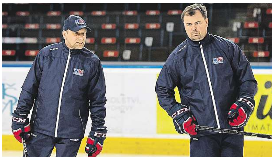
Trenér hokejové reprezentace Josef Jandač (vlevo) s asistentem Jaroslavem Špačkem

Dnes startuje 82. mistrovství světa v ledním hokeji. Poprvé v historii ho hostí Dánsko, hrát se bude v Kodani a Herningu.