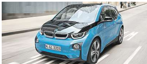
Sběratel vavřínů v nejrůznějších soutěžích a anketách BMW