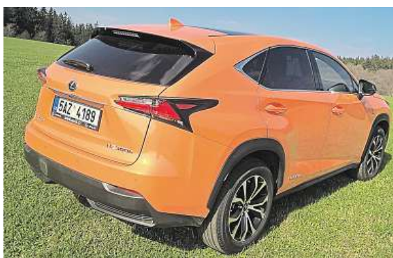
Za tím autem se zaručeně ohlédnete.