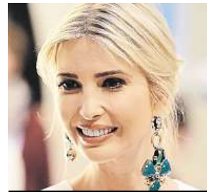
Ivanka Trumpová

Dcera prezidenta Donalda Trumpa Ivanka vydala svoji druhou knihu.