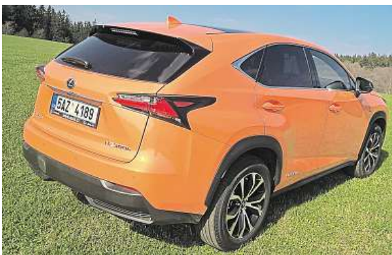
Za tím autem se zaručeně ohlédnete.