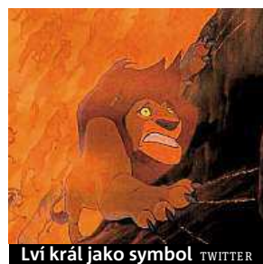
Lvi král jako symbol TWITTER

• Nottingham postoupil do nejvyšší soutěže poprvé v roce 1977, v další sezoně slavil titul a roku 1979 dokonce triumf v Poháru mistrů.