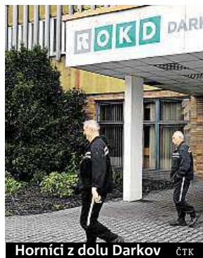
Horníci z dolu Darkov

„Představenstvo společnosti OKD rozhodlo o podání návrhu na povolení reorganizace s cílem zachovat zaměstnanost, provoz podniku, v co nejvyšší míře postupně uspokojit své věřitele a vytvořit životaschopnou společnost,“ vy-