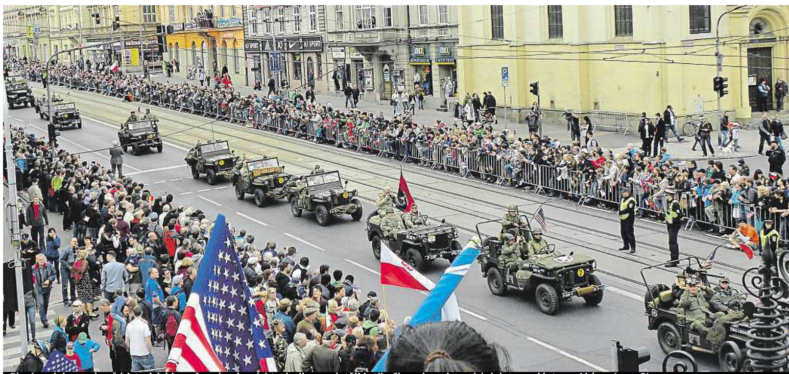
Plzeň projelo 300 kusů historické i současné vojenské techniky, proletěli i stíhačky gripen i armádní dopravní letoun Airbus A319 CJ.