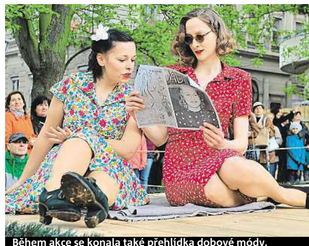
Během akce se konala také přehlídka dobové módy.