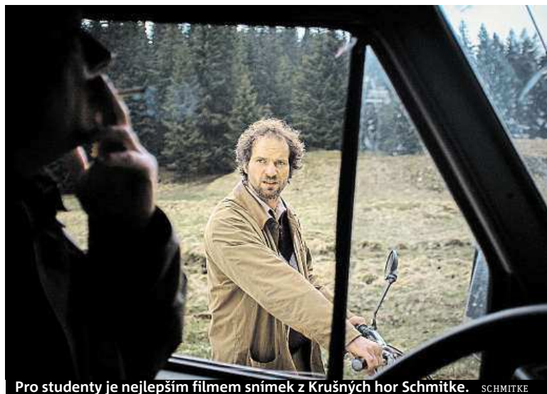
Pro studenty je nejlepším filmem snímek z Krušných hor Schmitke. SCHMITKE