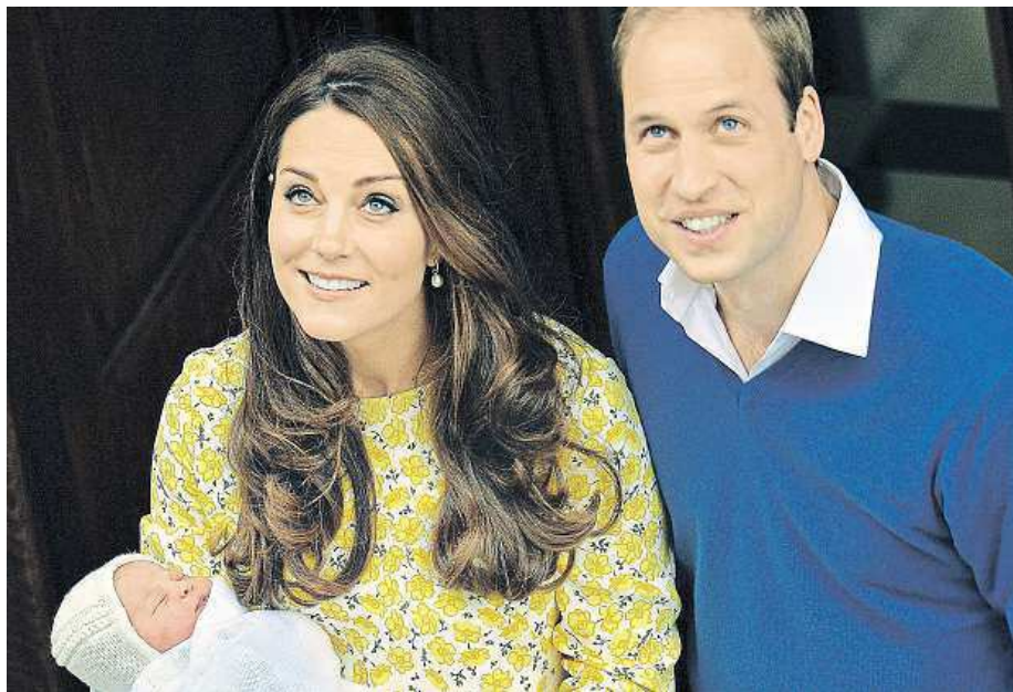
Princ William a jeho manželka vévodkyně Kate opouští v sobotu Nemocnici svaté Marie.

Británie čeká na oznámení jména novorozené dcery prince Williama a jeho manželky vévodkyně Kate.