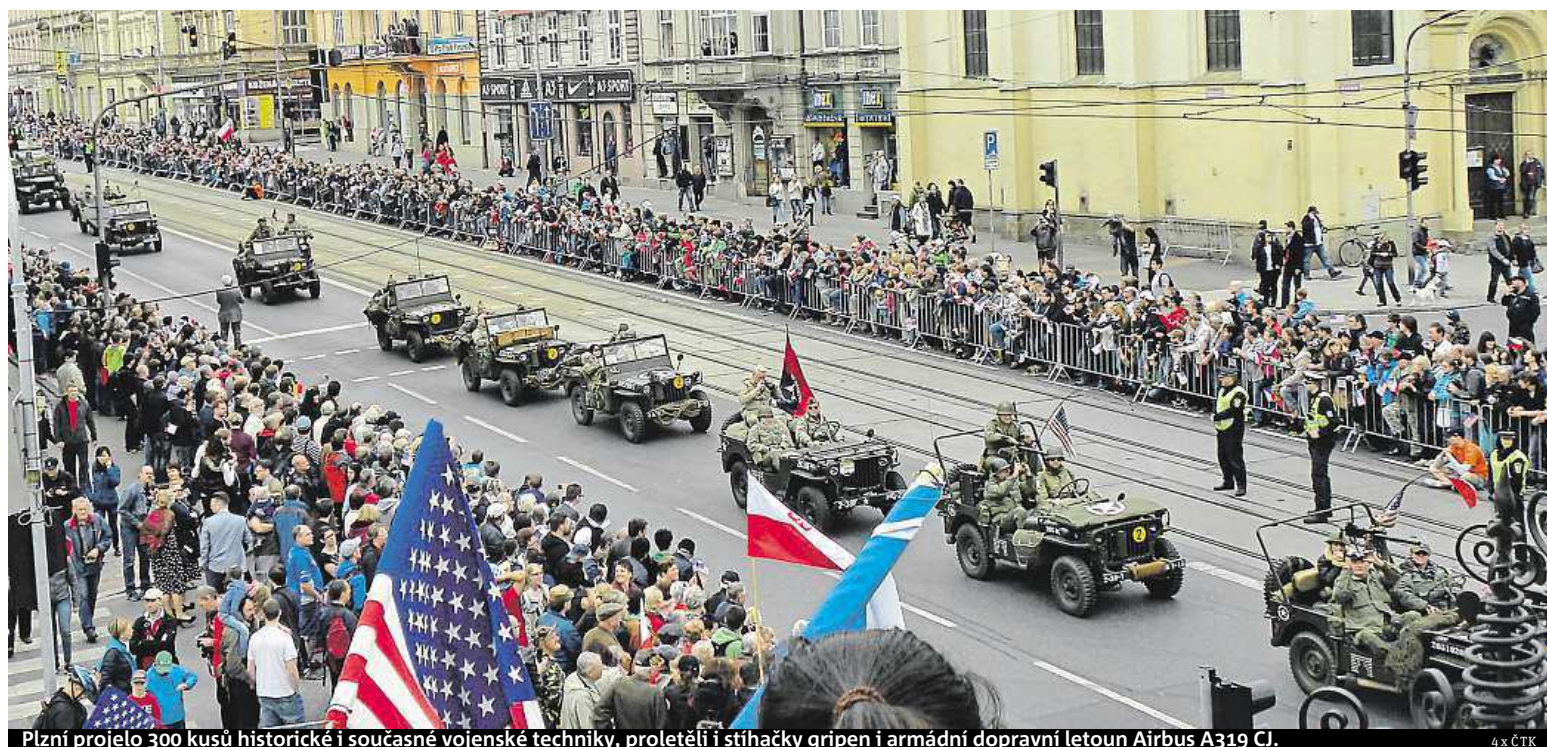
Plzeň projelo 300 kusů historické i současné vojenské techniky, proletěli i stíhačky gripen i armádní dopravní letoun Airbus A319 CJ.