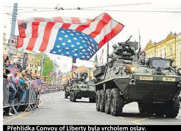
Přehlídka Convoy of Liberty byla vrcholem oslav.

a Belgie, kteří Plzeň před 70 lety osvobodili. Podle organizátorů velkolepé oslavy během víkendu přilákaly přes sto tisíc lidí. Slavnosti pokračují do 6. května, kdy je ukončí pietní akt u pomníku Díky, Ameriko! a závěrečný koncert v synagoze. ČTK, IDNES.cz