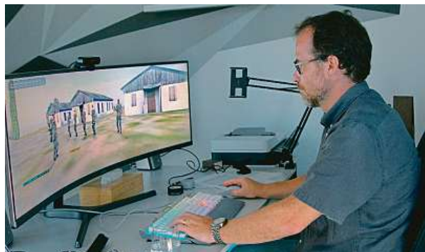
Série mapuje vývoj počítačových her i úspěchy českých tvůrců.

Seriál režíroval Štěpán FOK Vodrážka a Česká televize ho ve svém iVysílání nabídne bezprostředně po premiéře na letošním ročníku festivalu Comic-Con, tedy 6. dubna.