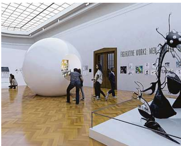
Expozice přenesse návštěvníky do světa Tima Burtona. ART MOVEMENT

Představme si rok Beetlejuice postupně. Už 1. května obsadí Prahu děsivé umění Tima Burtona. Součástí výstavy Ná-