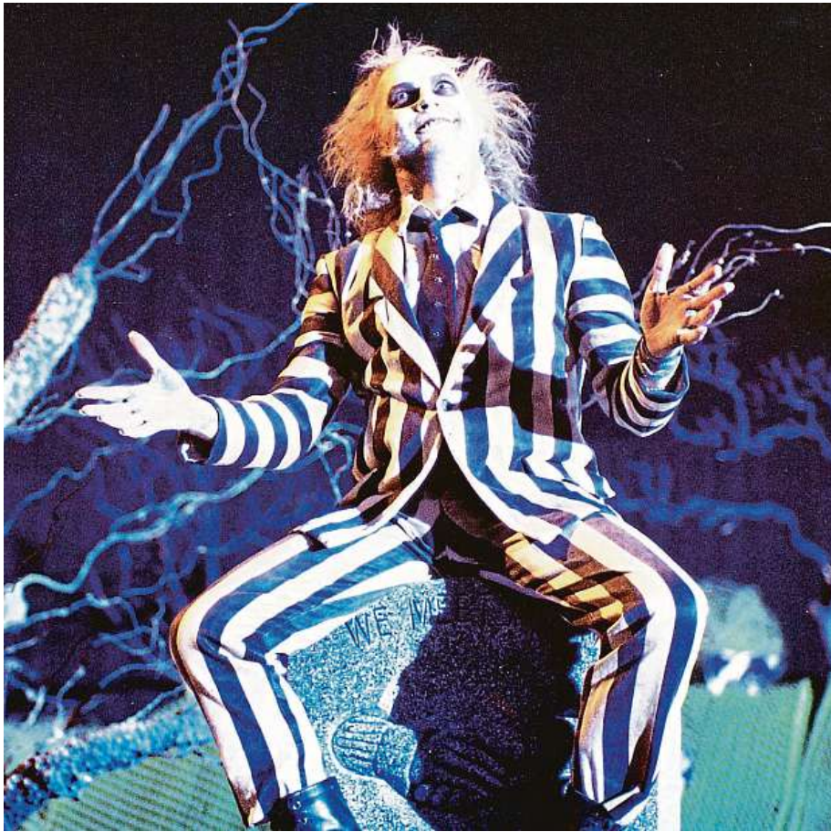
Snímek Beetlejuice získal v roce 1989 Oscara za nejlepší masky.