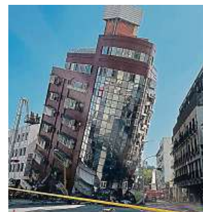
Zemětřesení v Chua-lienu

V cestovatelském systému Drozd je na Tchaj-wanu registrovaných 88 českých občanů. Ani v Japonsku podle Wernerové nejsou žádní zasažení Češi. Na Tchaj-wanu, který má 23 milionů obyvatel,