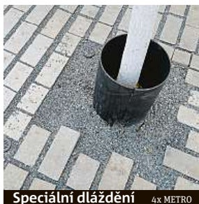
Speciální dláždění 4x METRO

– čemeřice, sněženky, podléšky, sasanky. Za prvními jarními květy už se Pražáci nemůžou vydat až do Divoké Šárky, Prokopského údolí nebo do botanické, rostou pár kroků od magistrály. „Naše rostliny ctíme, celkem je tu nějakých 230 druhů a polovina je domácích,“ vypráví Fous. Autoři parku měli zálusk i na české hořce, správa Krkonošského národního parku ale bohužel jejich žádost o několik exemplářů odmítla. Přenos dnešní zákony neumožňuje. „Je to trochu smutné, ale hořce, které tu můžete vidět, jsou nakonec z Německa, jakkoli samozřejmě od našich nejsou k rozeznání,“ ukazuje rašící rostlinku zahradní architekt.