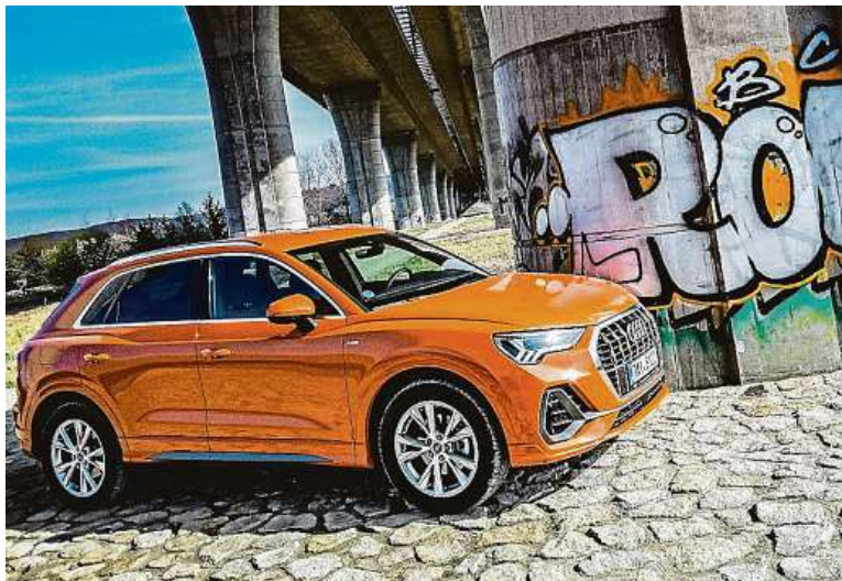
Oproti předchozí generaci auto narostlo, je díky modulární platformě delší.