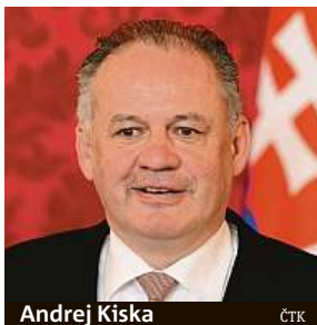
Andrej Kiska

Současný slovenský prezident z politiky odejde jako nestraní, ale obratem se do ní jako straník vrátí.