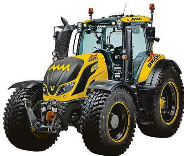
Návrh na design traktoru v barvách týmu

Devětadvacetiletý jezdec běžně závodí s kamionem Liaz, tentokrát však bude řídit traktor Valtra, který je s maximální rychlostí 136 kilometrů za hodinu zapsaný v Guinnessově knize rekordů.