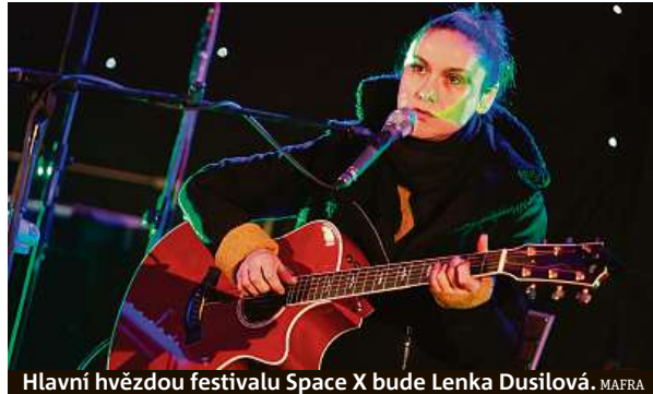
Hlavní hvězdou festivalu Space X bude Lenka Dusilová. MAFFRA

Na jednotlivé dny je pořídíte za 250 korun, na oba dva dny dohromady za 400 korun.