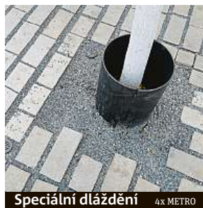
Speciální dláždění 4x METRO

– čemeřice, sněženky, podléšky, sasanky. Za prvními jarními květy už se Pražáci nemusí vydávat až do Divoké Šárky, Prokopského údolí nebo do botanické, rostou pár kroků od magistrály. „Naše rostliny ctíme, celkem je tu nějakých 230 druhů a polovina je domácích,“ vypráví Fous. Autoři parku měli zálusk i na české hořce, správa Krkonošského národního parku ale bohužel jejich žádost o několik exemplářů odmítla. Přenos dnešní zákony neumožňuje. „Je to trochu smutné, ale hořce, které tu můžeme vidět, jsou nakonec z Německa, jakkoli samozřejmě od našich nejsou k rozeznání,“ ukazuje rašící rostlinku zahradní architekt.