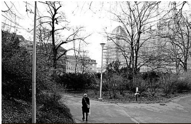
Venkovní expozice se skládá z 26 velkoplošných panelů.