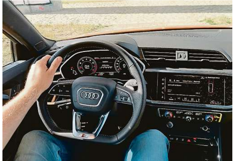
Na interiéru se nám líbí palubní deska vyvedená do mnohoúhelníků. 2x METRO

Parádní osmiúhelníková maska a LED světlomety, zářivá barva, k tomu digitální kokpit. Ovšem také ambiciózní cena.