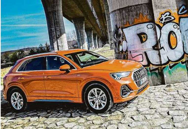
Oproti předchozí generaci auto narostlo, je díky modulární platformě delší.