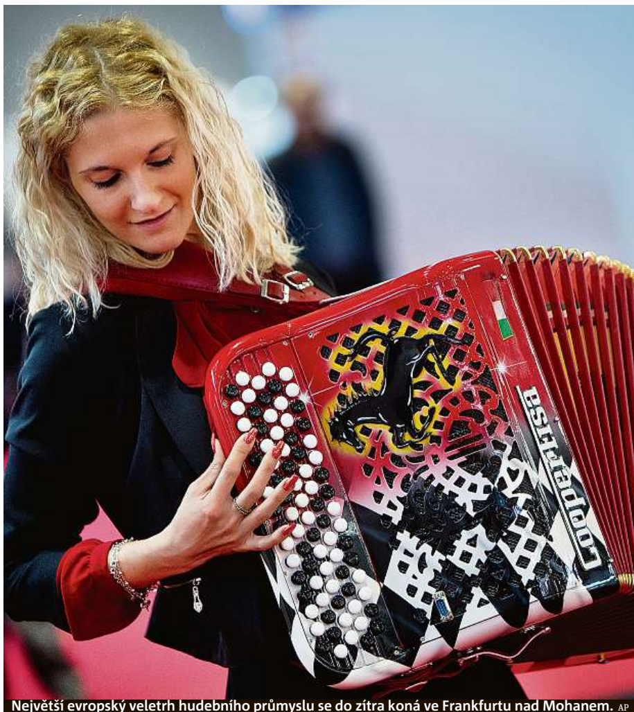
Největší evropský veletrh hudebního průmyslu se do zítřka koná ve Frankfurtu nad Mohanem.

NOVÝ FILM OD TVŮRČU TEORIE TYGRA TERORISTKA V KINECH OD 4. DUBNA 2019