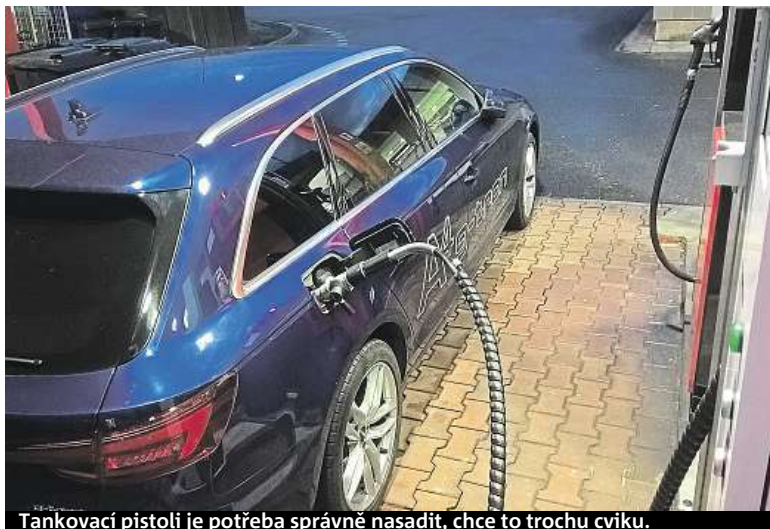
Tankovací pistoli je potřeba správně nasadit, chce to trochu cviku.