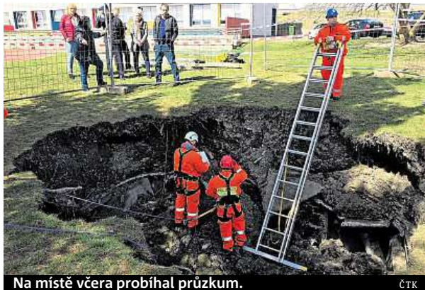
Na místě včera probíhal průzkum.

Učitelé ze Základní školy Bratří Venclíků se bojí, že si sem děti z Prahy 14 přijdou hrát na průzkumníky.