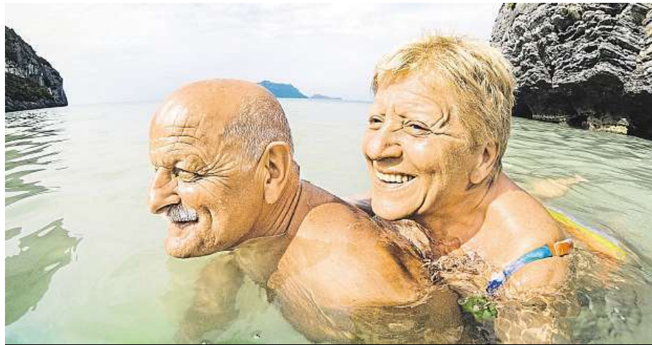
Chatu na pár dní vymění za dovolenou u moře.

Mezi nejoblíbenější seniorské regiony patří Řecko, Itálie, Bulharsko a Španělsko s Baleárskými nebo Kanárskými ostrovy. Pokud senioři zamíří dál od Evropy, je to nejčastěji do Turecka, Tunisu a v posledních sezonách opět do Egypta. Pro většinu je ale limitující délka letu. To přiznává Jan Bezděk, tiskový mluvčí