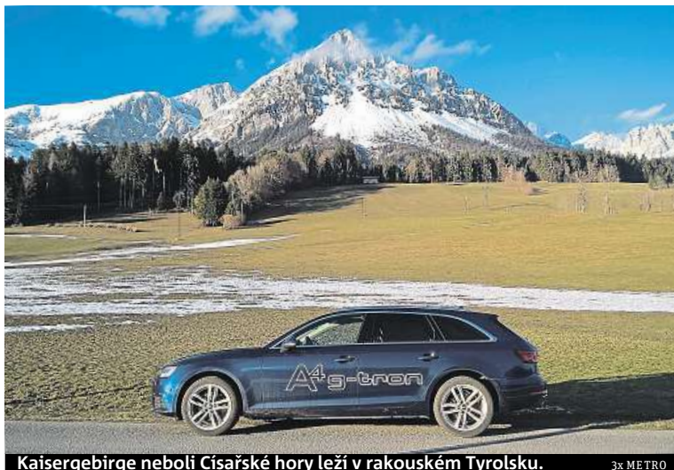
Kaisergebirge neboli Císařské hory leží v rakouském Tyrolsku.