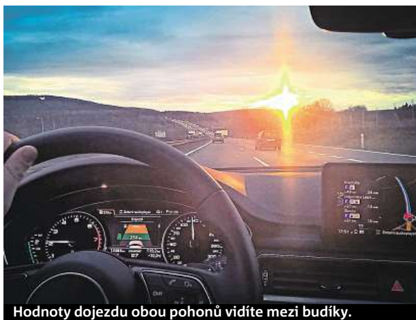
Hodnoty dojezdu obou pohonů vidíte mezi budíky.

Celkem má ministerstvo na dotační program pro podporu infrastruktury pro alternativní paliva v operačním programu vyčleněno 1,2 miliardy korun. ĚTK