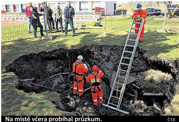
Na místě včera probíhal průzkum.