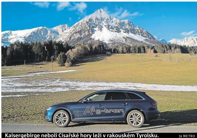
Kaisergebirge neboli Císařské hory leží v rakouském Tyrolsku.