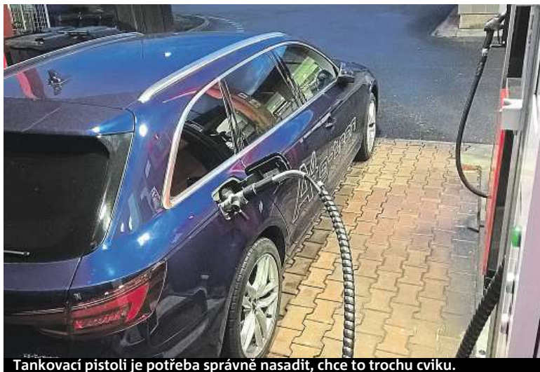
Tankovací pistoli je potřeba správně nasadit, chce to trochu cviku.