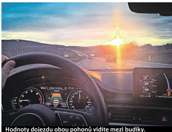
Hodnoty dojezdu obou pohonů vidíte mezi budíky.

Celkem má ministerstvo na dotační program pro podporu infrastruktury pro alternativní paliva v operačním programu vyčleněno 1,2 miliardy korun. ĚTK