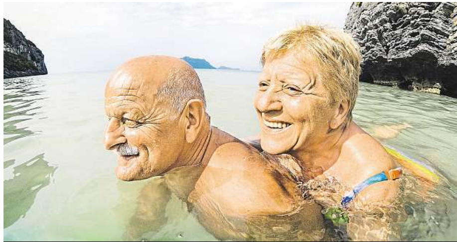
Chatu na pár dní vymění za dovolenou u moře.