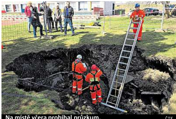
Na místě včera probíhal průzkum.

Učitelé ze Základní školy Bratří Venclíků se bojí, že si sem děti z Prahy 14 přijdou hrát na průzkumníky.