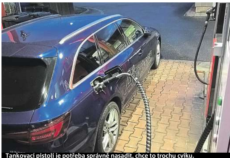
Tankovací pistoli je potřeba správně nasadit, chce to trochu cviku.