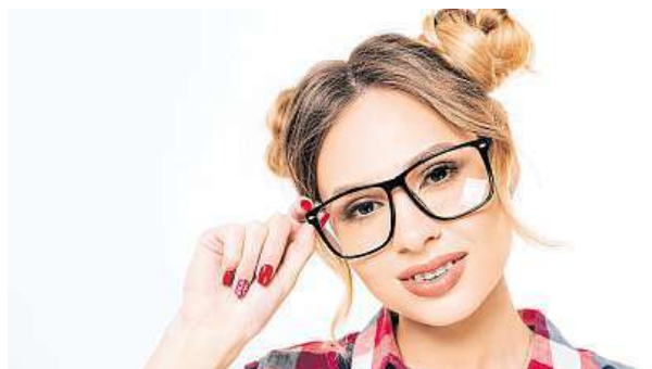
Rovnátko si vybírejte velmi pečlivě.