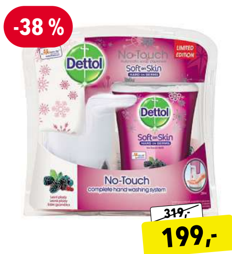
DETTOL Lesní plody 250 ml bezdotykový dávkovač mýdla