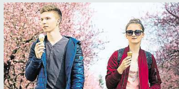
Teplé počasí končí. Teploty spadnou k 8 stupňům. MAFRA