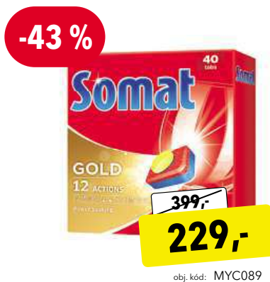
Somat Gold 40 ks tablety do myčky