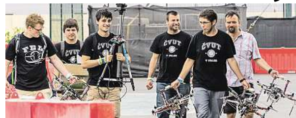
Tým se v Abú Zabí takto chystal do akce.

Tým, komu by mohly vzít práci, jsou noční strážníci bu-