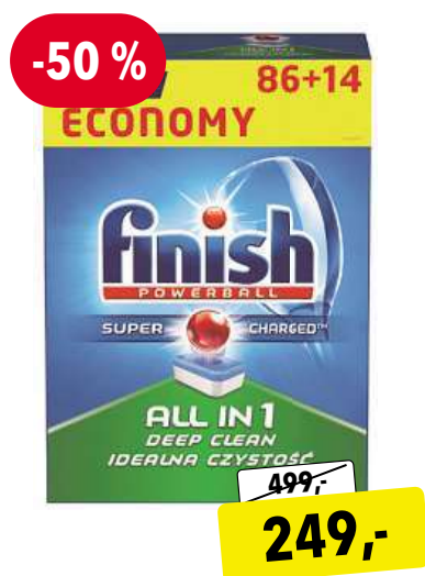
Finish All in 1 - 100 ks tablety do myčky