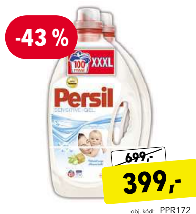
Persil Sensitive 100 prání gel na praní pro citlivou pokožku

Kup na www.alza.cz/maxi nebo volej 225 340 111