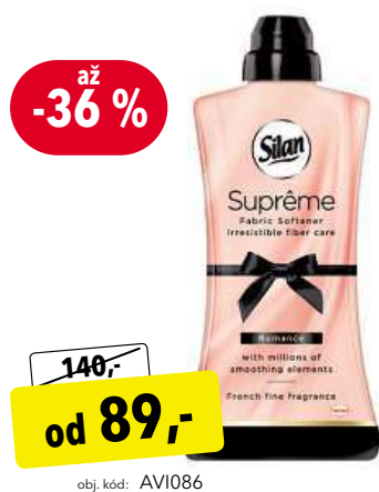
Silan Suprême 1 200 ml parfémovaná aviváž