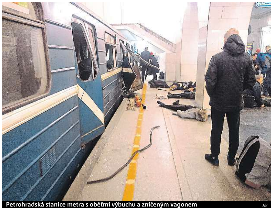
Petrohradská stanice metra s oběmi výbuchu a zničeným vagonem

Prezident Vladimir Putin uvedl, že vyšetřovatelé prověřují všechny verze včetně terorismu. Putin měl včera v Petrohradě jednání s běloruským prezidentem Alexandrem Lukašenkem.