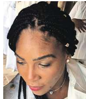
S. Williamsová

Rumun Nastase, člen tenisové síně slávy, totiž v rozhovoru pro Digi Sport uvedl, že aktuální světová dvojka Serena Williamsová musí brát zakázané prostředky. „Rusko kvůli dopingu výrazně utrpělo. Vezměte si ale takovou Se-