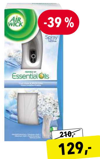
Airwick Vůně prádla 250 ml automatický sprej komplet