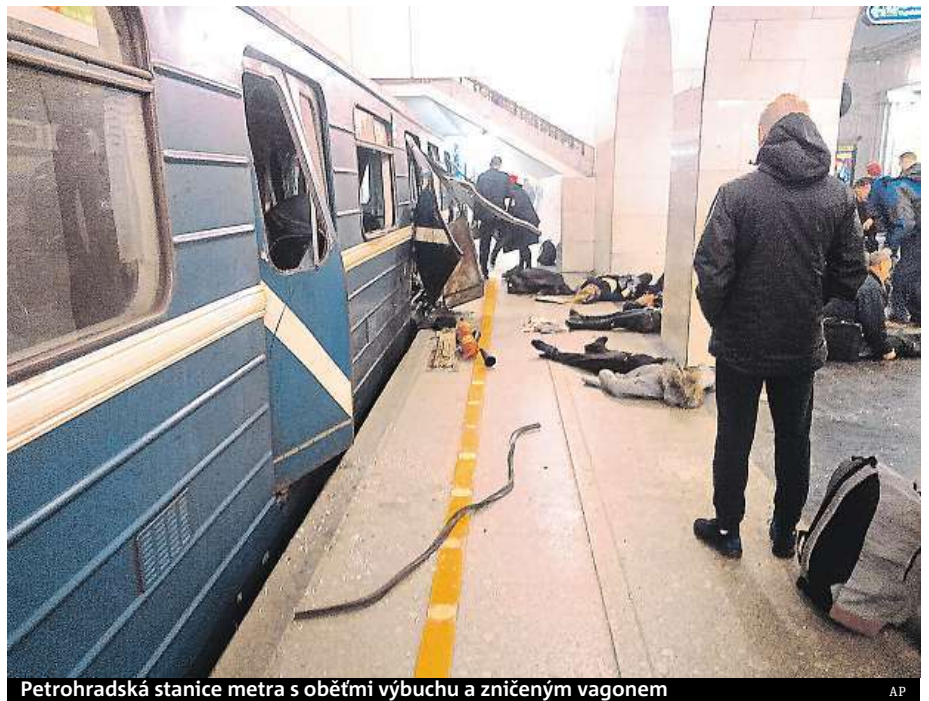
Petrohradská stanice metra s oběťmi výbuchu a zničeným vagonem

Prezident Vladimir Putin uvedl, že vyšetřovatelé prověřují všechny verze včetně terorismu. Putin měl včera v Petrohradě jednání s běloruským prezidentem Alexandrem Lukašenkem. ČTK, MET