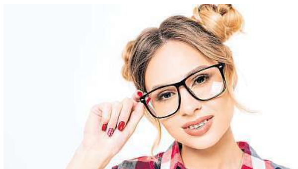
Rovnatka si vybírejte velmi pečlivě.