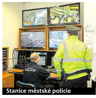
Stanice městské policie

• „Obyvatele města trápí přehuštěná doprava a zácpy. Školní autobus může pomoci mnoha školákům, jejich rodičům i řidičům,“ vysvětlil důvody, proč autobus město zvažuje, jeho starosta Vladimír Kořen.