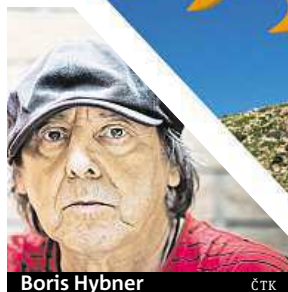
Boris Hybner