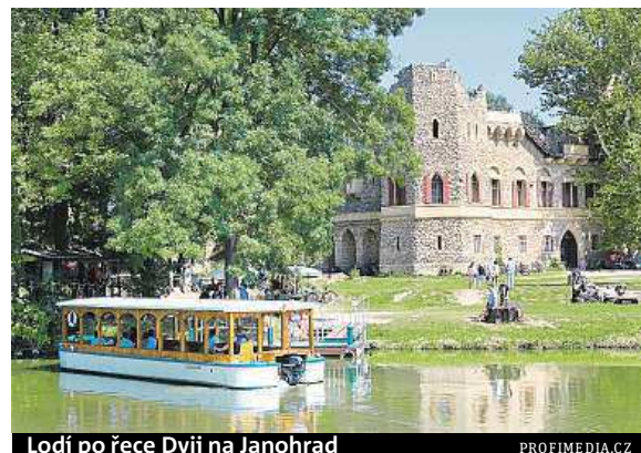
Lodí po řece Dyji na Janohrad