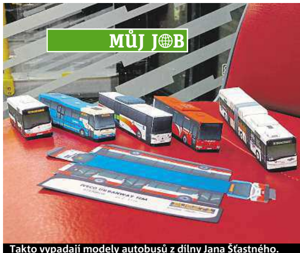
Takto vypadají modely autobusů z dílny Jana Šťastného.

Modely si nenechává jen pro sebe, ale bezplatně umožňuje jejich stažení na své webové stránce komukoliv. Za léta složil 57 autobusů, které jezdí v rámci Pražské inte-