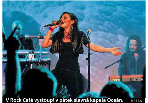
V Rock Café vystoupí v pátek slavná kapela Oceán. MAIRA

možřejmě pro originální pejsky, jako jsou kříženci. Do soutěže se může zapojit kdokoli, budou v různých kategoriích. Kemp Džbán, 7.30 – 16.30