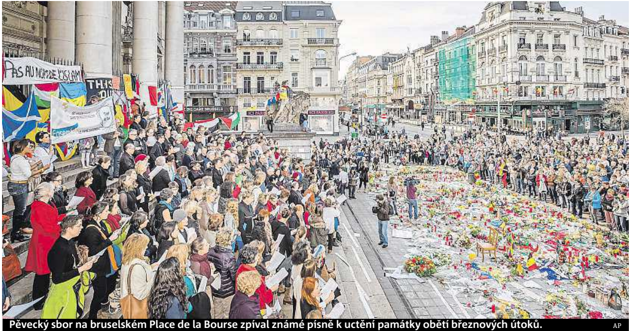
Pěvecký sbor na bruselském Place de la Bourse zpíval známé písně k uctění památky obětí březnových útoků.

K výbuchům došlo 22. března ráno na bruselském letišti Zaventem a ve stanici metra Maelbeek poblíž budov evropských institucí. Zahynulo při nich nejméně 32 lidí a asi 340 bylo zraněno. COB, ČTK