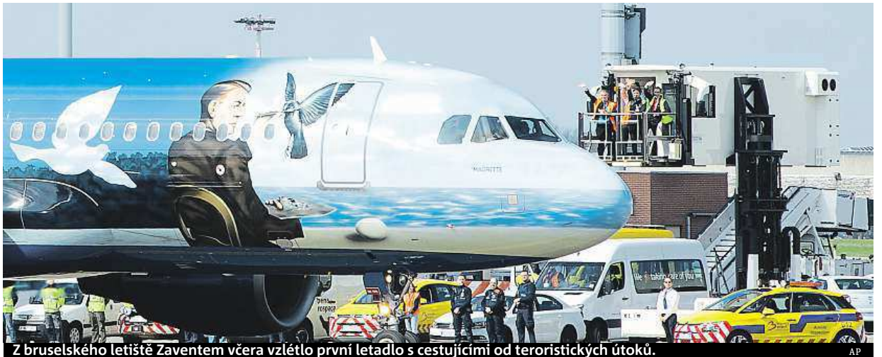
Z bruselského letiště Zaventem včera vzlétlo první letadlo s cestujícími od teroristických útoků.