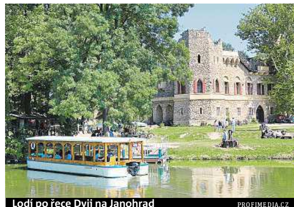
Lodí po řece Dyji na Janohrad