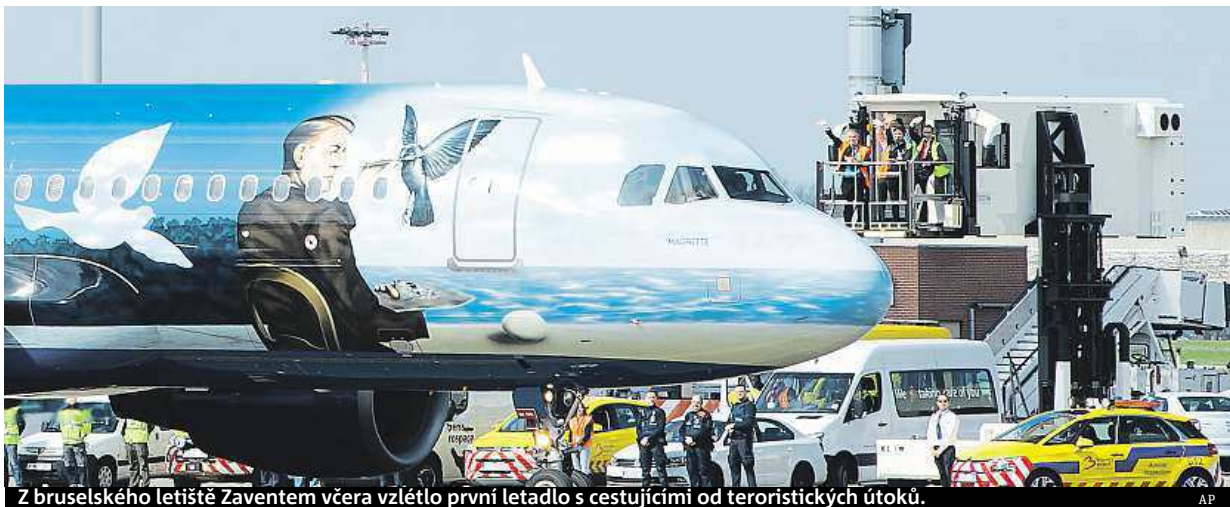
Z bruselského letiště Zaventem včera vzlétlo první letadlo s cestujícími od teroristických útoků.