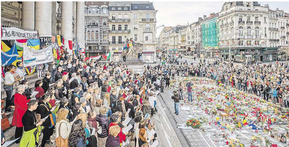
Pěvecký sbor na bruselském Place de la Bourse zpíval známé písně k uctění památky obětí březnových útoků.

K výbuchům došlo 22. března ráno na bruselském letišti Zaventem a ve stanici metra Maelbeek poblíž budov evropských institucí. Zahynulo při nich nejméně 32 lidí a asi 340 bylo zraněno. COB, ČTK