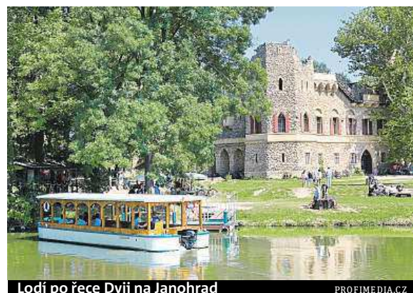
Lodí po řece Dyji na Janohrad