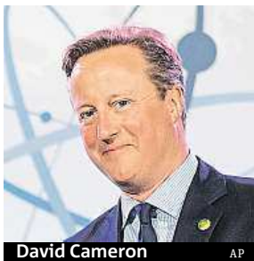
David Cameron AP

V červnovém referendu v Británii o členství země v Evropské unii bude mít klíčový význam volební účast mladých voličů ve věku 18 až 34 let. Ukazuje to nový průzkum, podle kterého se sice britští mladí voliči převážně kloní k setrvání britských ostrovů v Unii, ale většina z nich stále neví, zda půjde hlasovat. Uvedl to včera britský nedělník The Observer. Čím jsou voliči starší, tím podle ankety více podporují odchod z EU. „Vládní strategie a autoři průzkumů soukromě připouštějí, že hlavním problémem pro