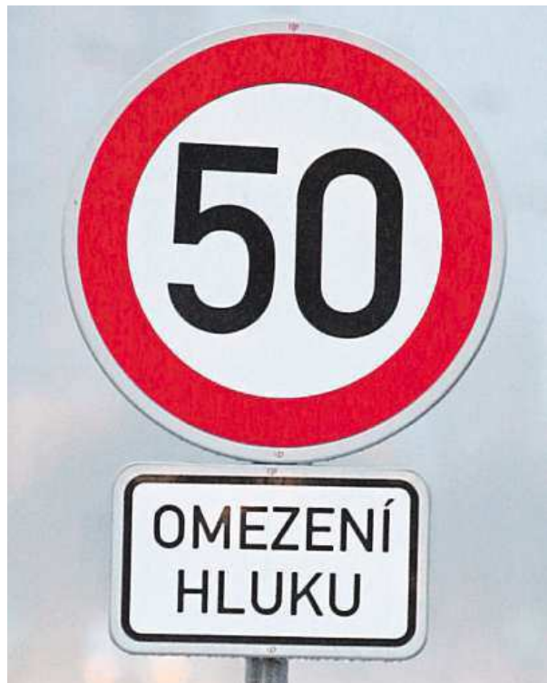
Značka, kterou znají řidiči na pražské magistrále.

• Do roku 2020 má být v Česku investováno do konceptu takzvané chytré dopravy až 17,5 miliardy korun. Do silnic by měla jít zhruba polovina peněz, přesná částka za nové kamery nebo radary ale zatím není jasná.