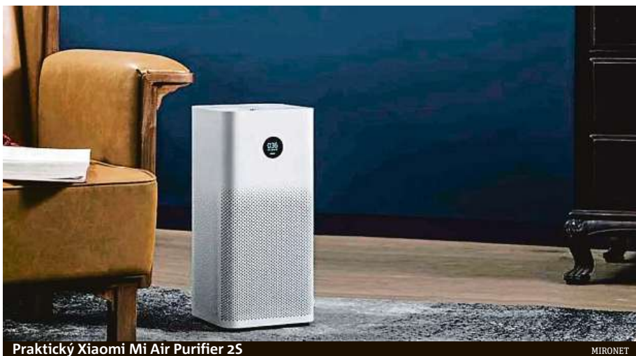
Praktický Xiaomi Mi Air Purifier 2S

Odpovědí na obě otázky je chytrá čistička vzduchu, která vás těchto problémů spolehlivě zbaví. Mezi přední výrobce chytrých elektronických doplňků pro domácnost patří společnost Xiaomi, jejíž model Mi Air Purifier 2S je jednou z nejlepších čističek vzduchu na trhu. Zařízení bě-