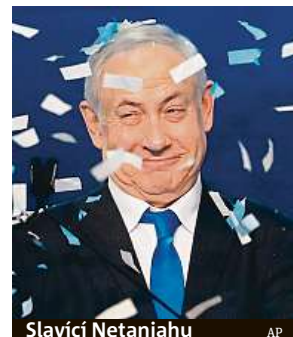
Slavící Netanjahu

Nejdéle vládnoucí izraelský premiér v parlamentních volbách znovu uspěl.