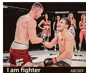
I am fighter