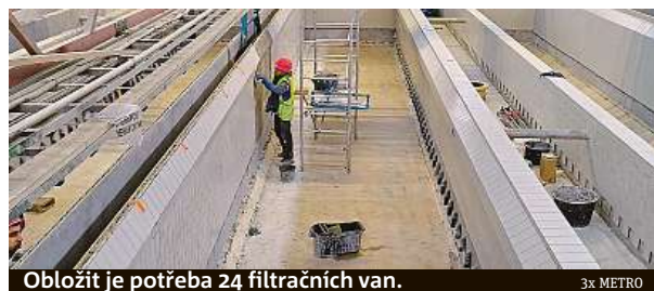
Obložit je potřeba 24 filtračních van.