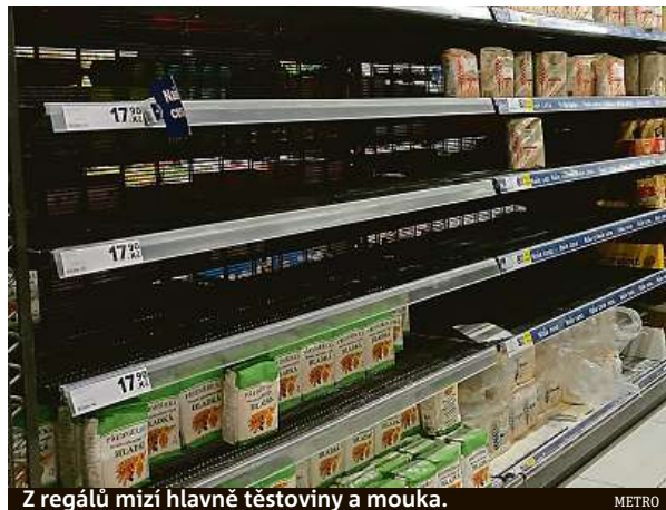
Z regálů mizí hlavně těstoviny a mouka.

Je otázka, jestli nakonec mnohé potraviny nakoupené v panice dopředu neskončí v kontejnerech. I přes vysokou trvanlivost může hlavně moučná jídla poškodit špatné skladování. „Mouka má obvykle dobu spotřeby půl roku,“ říká zástupkyně firmy Mlýn Veselí nad Lužnicí. Záleží na uskladnění. „Vyžaduje chlad a sucho, pak vydrží i rok, hospodyňky by ji ale měly před použitím prosít,“ radí paní ze mlýna. Pochybuje však o tom, že by lidé, kteří