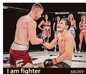
I am fighter