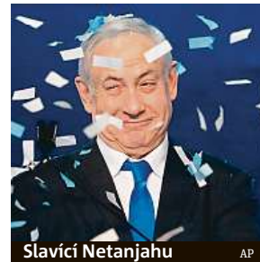
Slavící Netanjahu

Nejdéle vládnoucí izraelský premiér v parlamentních volbách znovu uspěl.