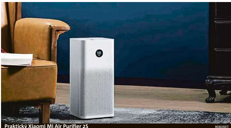
Praktický Xiaomi Mi Air Purifier 2S

Odpovědí na obě otázky je chytrá čistička vzduchu, která vás těchto problémů spolehlivě zbaví. Mezi přední výrobce chytrých elektronických doplňků pro domácnost patří společnost Xiaomi, jejíž model Mi Air Purifier 2S je jednou z nejlepších čističek vzduchu na trhu. Zařízení bě-