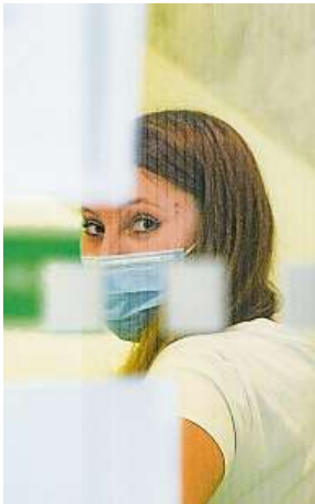
Sestra z Nemocnice Na Homolce a vstup do kliniky infekčních nemocí v Hradci Králové