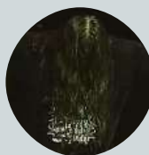
Filip Zuska Vůbec! Miluju ho. Vadí mi slunce a teplo.