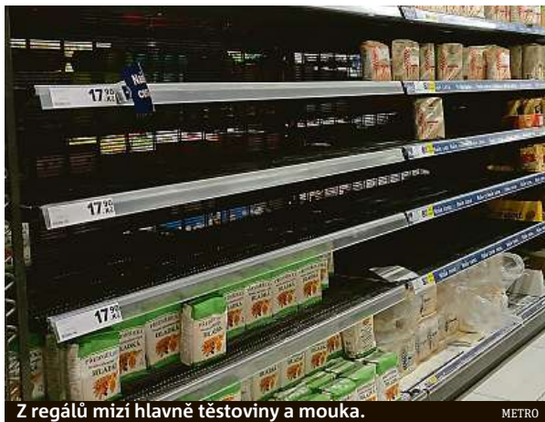
Z regálů mizí hlavně těstoviny a mouka. METRO

Je otázka, jestli nakonec mnohé potraviny nakoupené v panice dopředu neskončí v kontejnerech. I přes vysokou trvanlivost může hlavně moučná jídla poškodit špatné skladování. „Mouka má obvykle dobu spotřeby půl roku,“ říká zástupkyně firmy Mlýn Veselí nad Lužnicí. Záležejí na uskladnění. „Vyžaduje chlad a sucho, pak vydrží i rok, hospodyňky by ji ale měly před použitím prosít,“ radí paní ze mlýna. Pochybuje však o tom, že by lidé, kteří