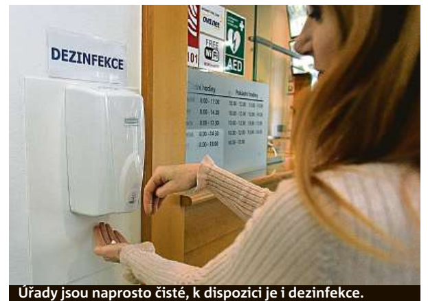
Úřady jsou naprosto čisté, k dispozici je i dezinfekce.

U nemocných Čechů má nákaza zatím lehký průběh. Krajské nemocnice jsou připraveny.