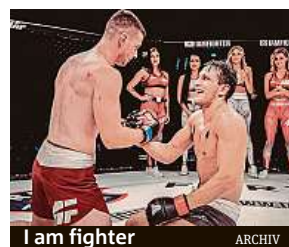
I am fighter