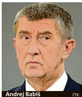
Andrej Babiš

svém Twitteru. Babiš kritizoval Zdechovského a Peksu v souvislosti s delegací europoslanců, která v uplynulých dnech v Praze navštívila některé úřady, aby zjišťovala fakta o jeho údajném střetu zájmů. „Zdechovský a Peksa jsou vlastizrádci, měli by bojovat za české zájmy,“ řekl minulý týden Babiš novinářům. Zopakoval, že ve střetu zájmů není. Delegaci označil za politickou misi. IDNES.cz