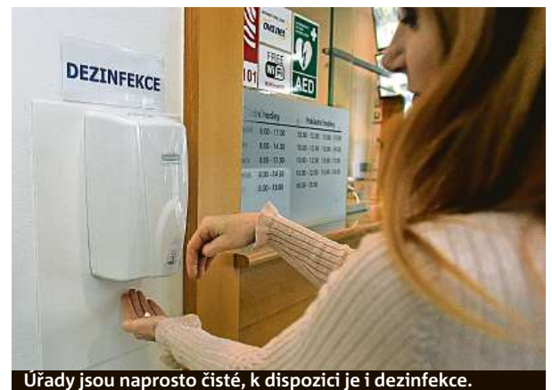
Úřady jsou naprosto čisté, k dispozici je i dezinfekce.

U nemocných Čechů má nákaza zatím lehký průběh. Krajské nemocnice jsou připraveny.