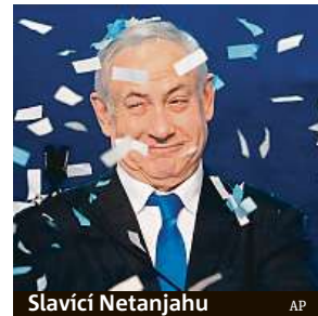
Slavící Netanjahu

Nejdéle vládnoucí izraelský premiér v parlamentních volbách znovu uspěl.