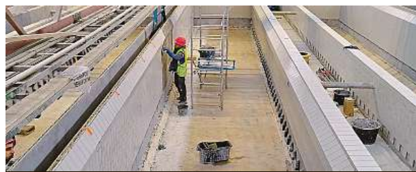
Obložit je potřeba 24 filtračních van.