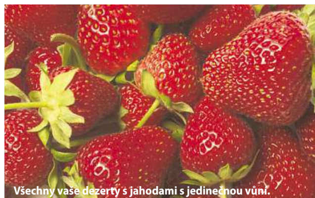
Všechny vaše dezerty s jahodami s jedinečnou vůní.