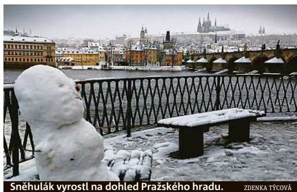
Sněhulák vyrostl na dohled Pražského hradu. ZDENKA TÝCOVÁ

Silné sněžení zasáhlo většinu Čech. I dnes má sněžit, ke konci týdne se oteplí a bude pršet.