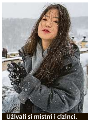
Užívali si místní i cizinci.