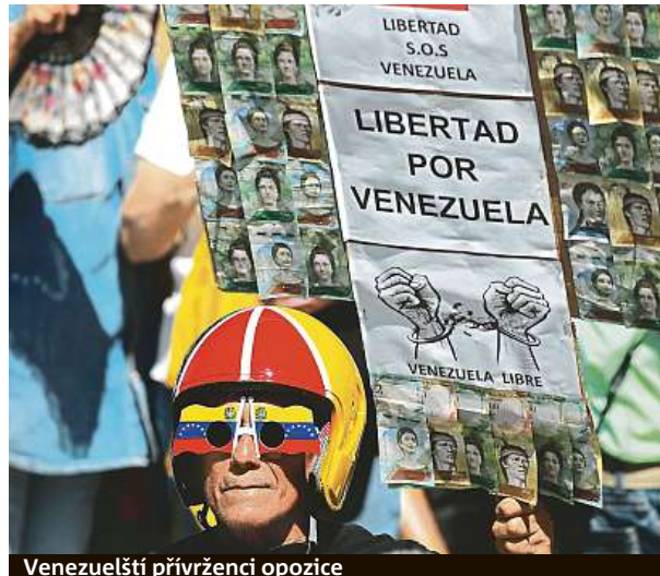
Venezuelští přívrženci opozice