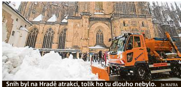
Sněh byl na Hradě atrakcí, tolik ho tu dlouho nebylo. 3x MAFRA