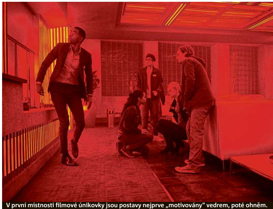
V první místnosti filmové únikovky jsou postavy nejprve „motivovány“ vedrem, poté ohněm.

Film Úniková hra se podle mého názoru stoprocentně v kinech brzy dočká druhého dílu. Nebude to ale proto, že si do něj tvůrci otevřeným koncem sebevědomě nakra-