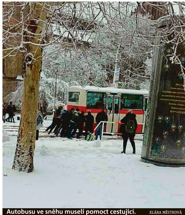
Autobusu ve sněhu museli pomoci cestující. KLÁRA MĚSTKOVÁ