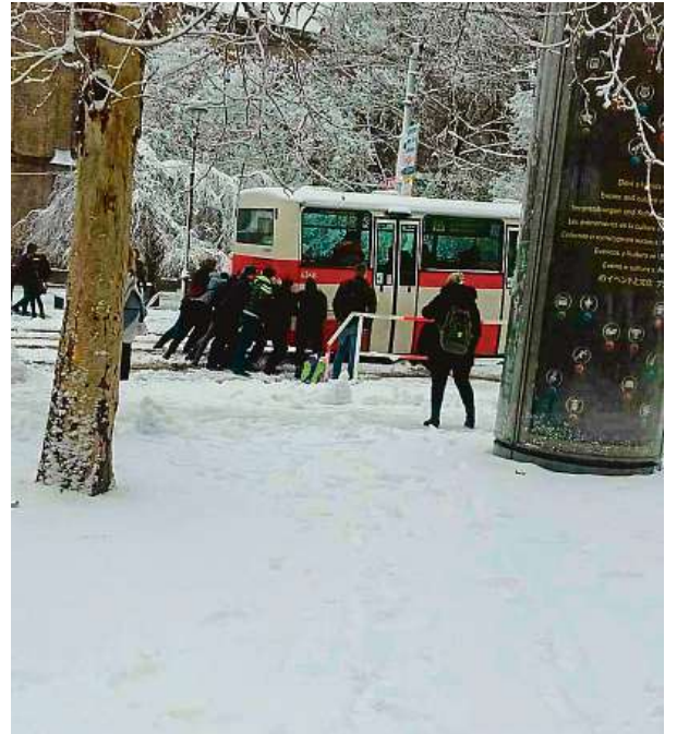
Autobusu ve sněhu museli pomoci cestující.