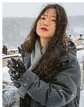
Užívali si místní i cizinci.