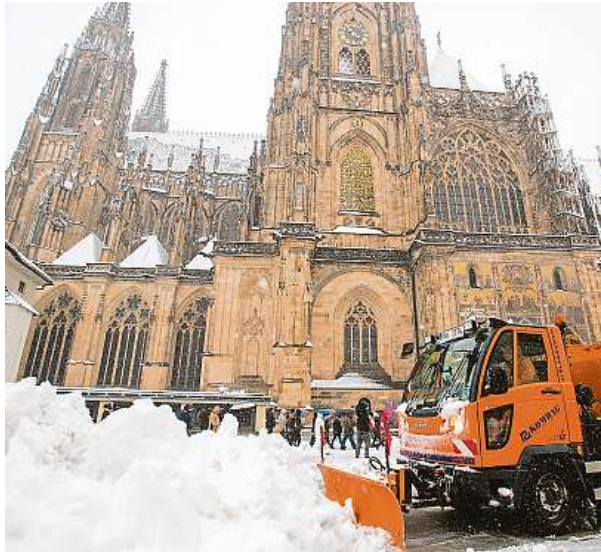
Sněh byl na Hradě atrakcí, tolik ho tu dlouho nebylo.