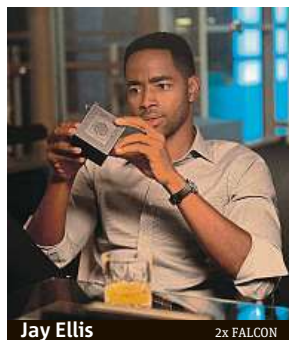
Jay Ellis 2x FALCON

Snímek vypráví příběh šesti lidí, kteří přijali výzvu zúčastnit se únikové hry. Velmi brzy ale zjistí, že z téhle srandy cesta ven vlastně neexistu-