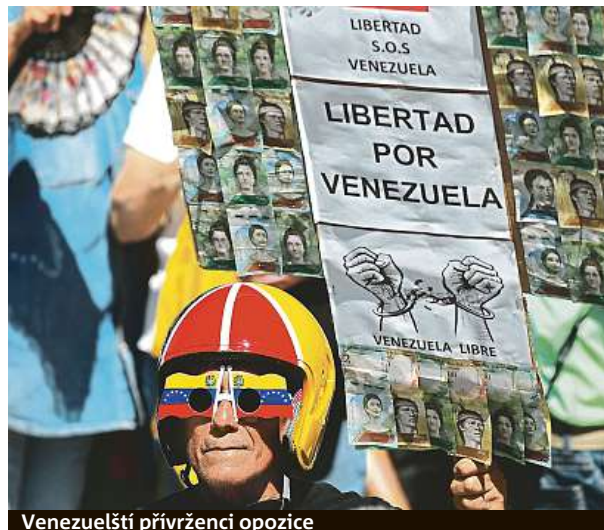
Venezuelští přívrženci opozice

stoupence. Vysoce postavený generál venezuelského letectva Francisco Yanez oznámil, že neuznává autoritářského prezidenta Madura a za vůdce země považuje Juana Guai-