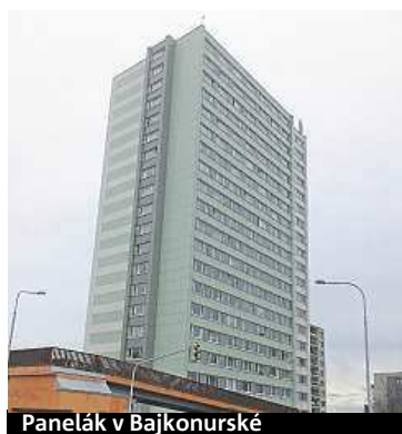
Panelák v Bajkonurské

če v přímém přenosu. Občas se dokonce i sama kamera stane cílem útoku. „Jednu vandalové rozbili, další posprejovali,“ upřesnil Vrkoč.