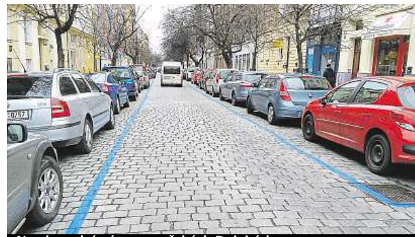
Nové modré zóny v pražských Dejvicích

Nezvykle rušno je v ulicích na rozhraní Hradčan a Dejvic v Praze. Dělníci tu vyznačují nové parkovací zóny, které začnou v této části metropole platit od 1. května. „Hezké počasí umožnilo začít vyznačovat zóny dříve, než jsme předpokládali,“ potvrzuje mluvčí Technické správy komunikací Barbora Lišková. Pokud počasí vydrží, začnou dělníci i betonovat na místech, kde budou stát značky a parkovací automaty. ROW