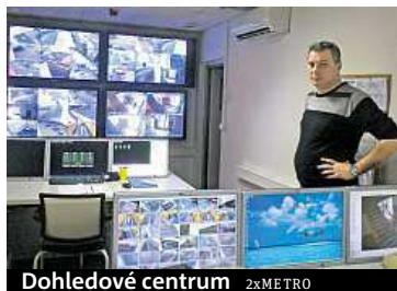
Dohledové centrum 2xMETRO

Záznamy slouží hlavně jako důkazní materiál. Jen výjimečně chytanou strážci vandala nebo zloděje při činu. Mnohem častěji video předávají na vyžádání policii. „Naposled díky nám do tří dnů chytili násilníka, který napadl vrátného v Opatově,“ pochválil své strážce Vrkoč. Přesto se několikrát za měsíc i stane, že hlídač na svém monitoru sleduje sprejera nebo opilého nahá-