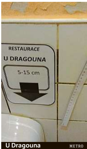
U Dragouna METRO

Na poněkud pepřejší WC má štěstí také náš kolega David Halatka. Ten se s námi podělil o fotografie z restaurace U Dragouna, která sídlí v Po-