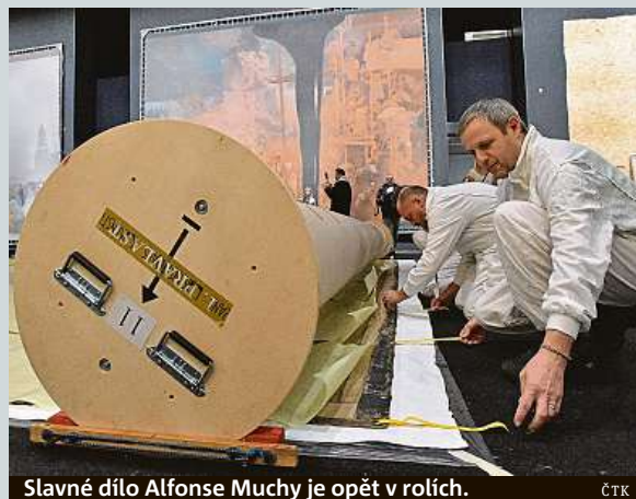
Slavné dílo Alfonse Muchy je opět v rolích.