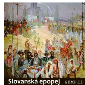
Slovanská epopej GHMP.CZ

Kde: Galerie Millennium Kdy: do 6. ledna Otevírací doba: denně kromě pondělí 12–18 hodin Vstupné: zdarma