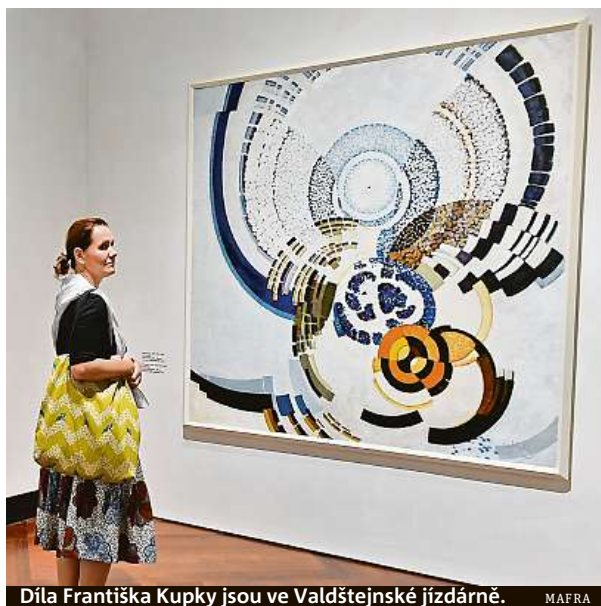
Díla Františka Kupky jsou ve Valdštejnské jízdárně.

Jedno z nejvýznamnějších českých veleďel z rukou Alfonse Muchy je přístupné až do 20. ledna. Slovanská epopej (tedy její část) je vystavena v Obecním domě.