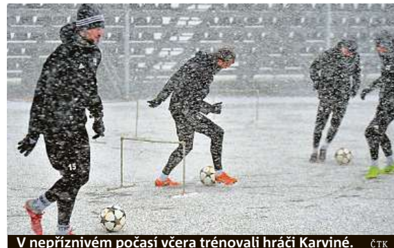
V nepříznivém počasí včera trénovali hráči Karvině.

Také zmíněná Mladá Boleslav zahájila přípravu fyzickými testy. Společně tým začne trénovat dnes. Ještě poz-