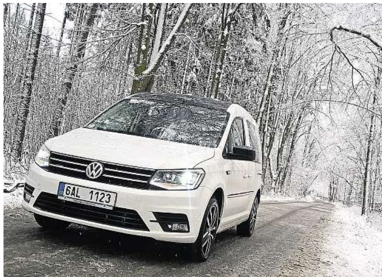
Caddy se prodává i s pohonem všech kol, což se v zimě vždycky hodí.

• Nyní jezdí caddy už jako čtvrtá generace. Objevila se i verze s pohonem na stlačený zemní plyn.