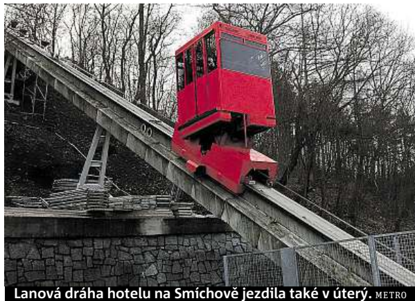
Lanová dráha hotelu na Smíchově jezdila také v úterý.