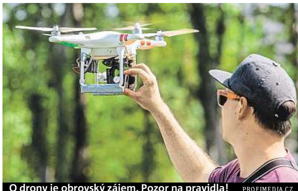
O drony je obrovský zájem. Pozor na pravidla!