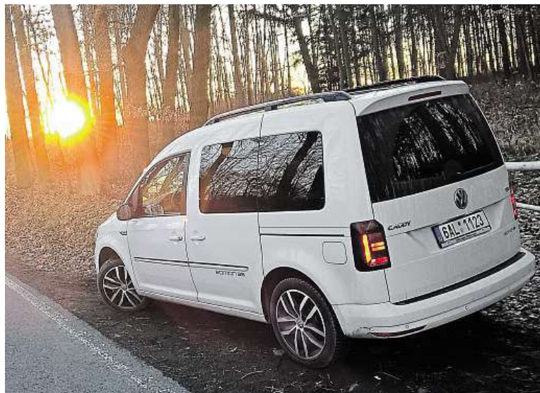
Černě lakované ližiny na střeše jsou připraveny držet nosiče lyží.