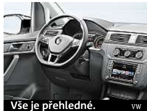
Vše je přehledné.

Kabina dodávku nepřipomíná vůbec. Už v základu je zde kožené čalounění s kontrastním prošíváním, multifunkční kožený volant, LED