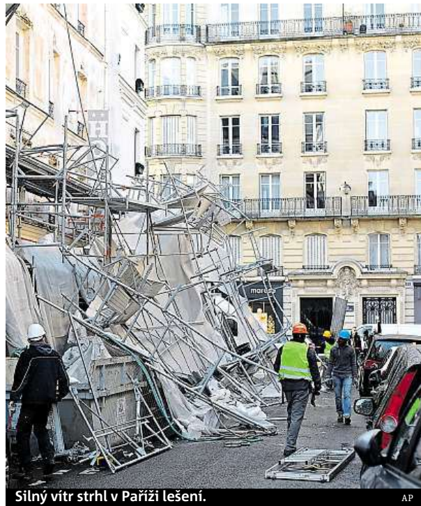
Silný vítr strhl v Paříži lešení.

Na hoře Pilatus u švýcarského Lucernu naměřili rekordní rychlost větru 195 kilometrů v hodině. To je nejsilnější vítr zaznamenaný od začátku měření v roce 1981. ČTK, MET