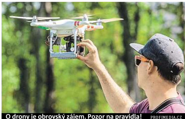
O drony je obrovský zájem. Pozor na pravidla!