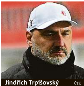
Jindřich Trpišovský ČTK

Ceští mistři, kteří vyhráli ve skupině třikrát za sebou, navíc budou chtít trápícímu se izraelskému celku vrátit říjnovou porážku 1:3. Duel má výkop v 21 hodin. Pražané získali ve skupině devět bodů stejně jako Leverkusen, naopak Beer Ševa s Nice pouze