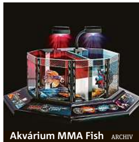
Akvárium MMA Fish

„Ryba bojovnice“, jak se po celém světě přezdívá řádu Betta splendens, je výjimečná. Samci této ryby nesou ve svém okolí žádné jiné ho samečka. Jakmile jej spatří, okamžitě jejich barvy nabudou na sytosti, roztáhnou své vějířovité ploutve a vyrazí svého soka zastrašit. Následuje rej barev a ladných rybích těl, která proti sobě vyra-