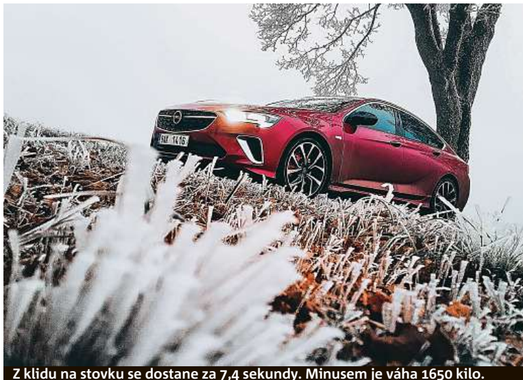
Z klidu na stovku se dostane za 7,4 sekundy. Minusem je váha 1650 kilo.