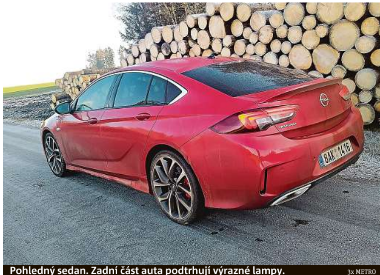
Pohledný sedan. Zadní část auta podtrhuji výrazné lampy.