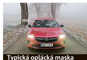
Typická oplácká maska