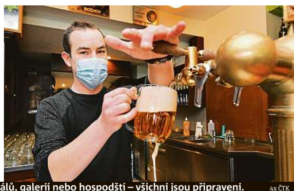
Provozovatelé sportovních areálů, galerií nebo hospodští – všichni jsou připraveni.

Opět mohou otevřít obchody, restaurace, muzea nebo památky. Končí noční zákaz vycházení.