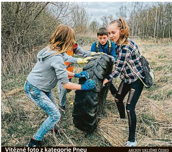
Vítězné foto z kategorie Pneu

Letos se jeho tým podařilo zlikvidovat pět černých skládek a na dvou vycházkách uklízeli odpadky po turistech v průběhu v Novinách pod Ralskem na Ploučnici a na Viničné cestě v Jizerských horách. Většinou tak odváželi stavební materiál a suť. „Zarážející ale byly spousty rámu od oken i s výplněmi, které našli kousek od řeky Ploučnice. Kdysi tam jeden občan vietnamské národnosti chtěl pěstovat zeleninu, ale nějak se mu to nevyvedlo.