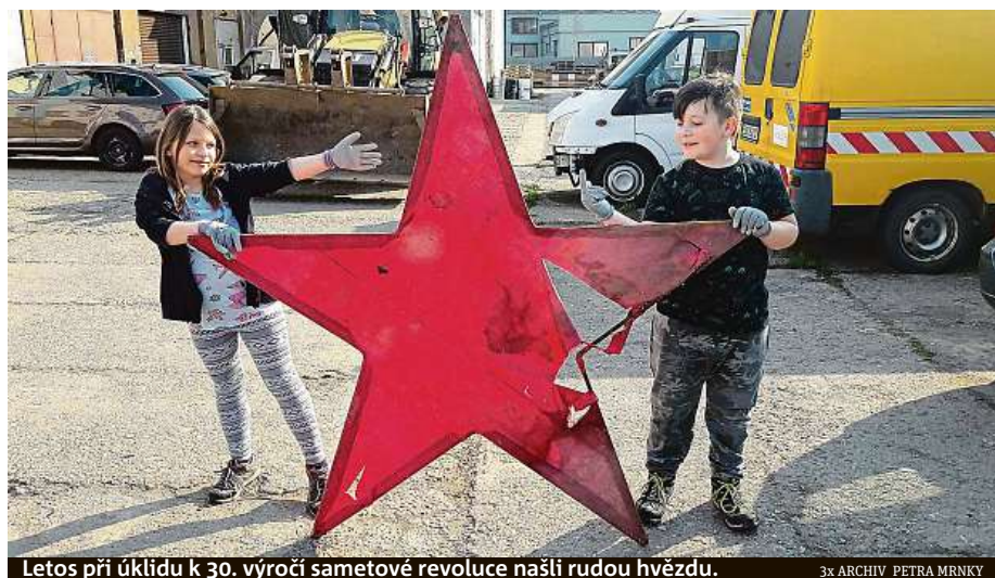
Letos při úklidu k 30. výročí sametové revoluce našli rudou hvězdu.