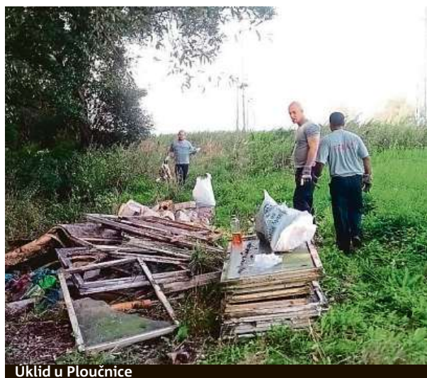
Uklid u Ploučnice