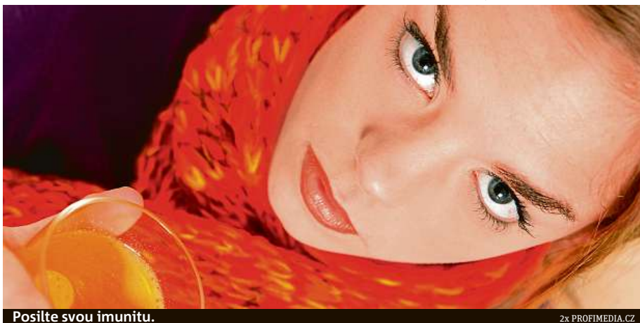
Posilte svou imunitu.

Konkrétně na rýmu a horní cesty dýchací zkuste například výtažky z jedle a borovi-