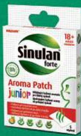
Aroma náplasti na oděv