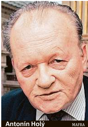
Antonín Holý

K nejvýznamnějším úspěchům české biomedicíny posledních desetiletí patří objev nových unikátních antivirových léčiv, která zachraňují životy milionům nemocných s hepatitidou B nebo AIDS. U jejich zrodu stála spolupráce Antonína Holého z Ústavu organické chemie a biochemie Akademie věd ČR a virologa Erika De Clercq z Katolické univerzity v belgické Lovani.