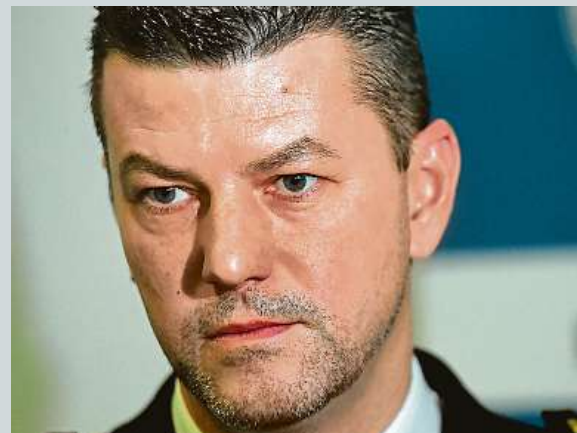
Jiří Zlý, nový šéf dopravní policie