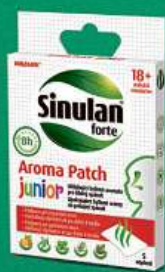
Aroma náplasti na oděv