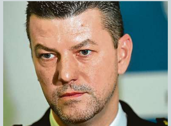
Jiří Zlý, nový šéf dopravní policie