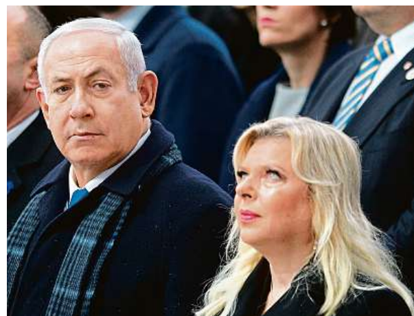
Izraelský premiér s manželkou

Kromě Netanjahuových by podle policie mohlo začít také stíhání mediálního magnáta Šaula Eloviche a jeho ženy Iris. V policejní zprávě zdůraznil, že je Netanjahu podezřelý z přijetí úplatků a z konfliktu zájmů. Výsledek vyšetřování policie předala úřadu