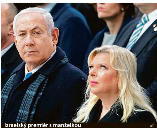
Izraelský premiér s manželkou

Opozice žádá odchod premiéra. Ten označuje aféru za hon na čarodějnice.