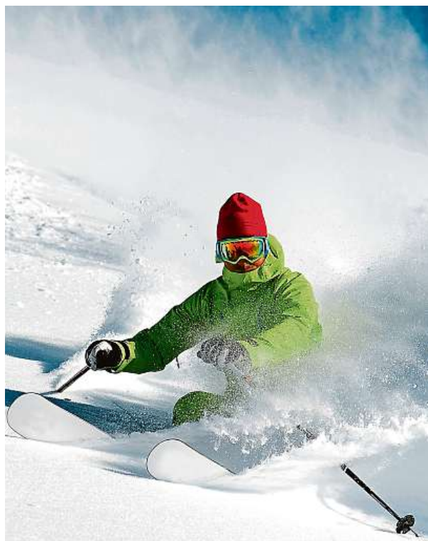
Lyžování v méně známém koutě Švýcarska

Andermatt. Zajímavá historie místa, kam dnes rádi jezdí free rideři.