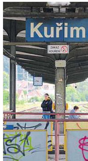
V létě autobusem MAFRA

Z Kuřimi však do Králova Pole pojedou i přímé spoje,