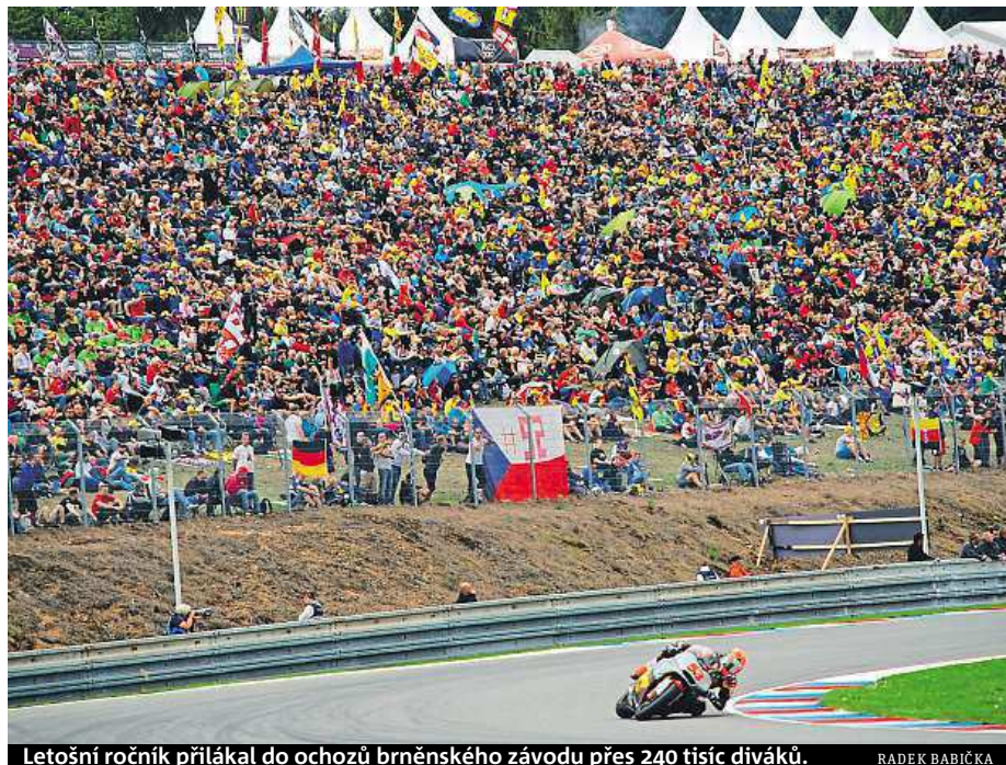
Letošní ročník přilákal do ochozů brněnského závodu přes 240 tisíc diváků.