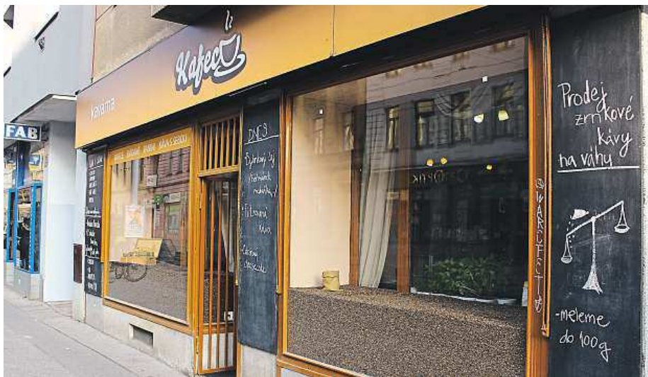
Pohled na kavárnu Kafec z ulice Veverí