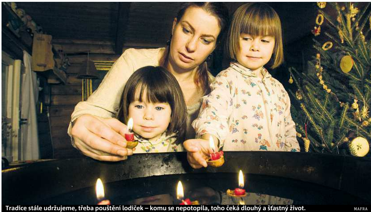
Tradice stále udržujeme, třeba pouštění lodiček – komu se nepotopila, toho čeká dlouhý a šťastný život.

Jižní či jihovýchodní Morava je tvořena několika subre-