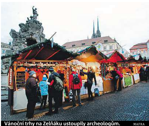
Vánoční trhy na Zelnáku ustoupily archeologům. MAFRA

„Vánoční trhy na Zelném trhu pro mě měly vždy zvláštní magickou vánoční atmosféru, kterou jistě pomáhá do- tvářet i charakter okolních budov. Proto mám toto místo raději než třeba náměstí Svobody. Také nabídka stánků měla většinou tradičtější re-