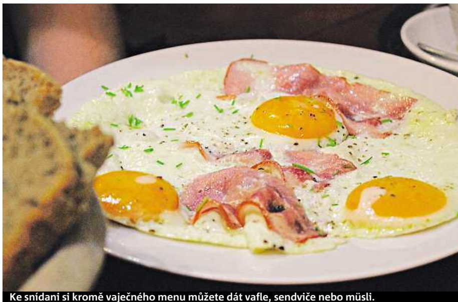
Ke snídani si kromě vaječného menu můžete dát vafle, sendviče nebo müsli.

Skleněné vitríny v kavárně nabízejí plno aeropressů, frenchpressů a podobného kavárenského vybavení, které je samozřejmě připraveno pro zájemce. MARIE VESELÁ