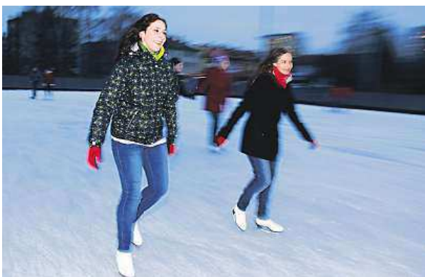
Kluziště v areálu Vodova najdete i letos.

Za Lužánkami letos zvýšili komfort zázemí pro bruslaře. „Nechali jsme rozšířit pryžový koberec podél budovy kolem laviček tak, aby se bruslaři mohli bezpečně pohybovat z kluziště k sociálnímu zařízení, aniž by museli sundat brusle nebo procházet budovou,“ popisuje novinku mluvčí společnosti Starez Sport Michaela Radimská. Ceny zůstávají stejně jako loni na pětadesáti korunách pro dospělé a pětatřiceti pro děti do čtrnácti let.