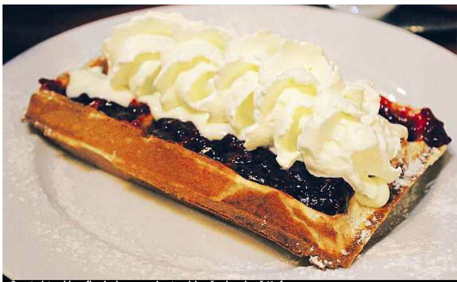
Čerstvá teplá vafle, jedna z variant snídaně v kavárně Kafec