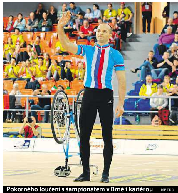
Pokorného loučení s šampionátem v Brně i kariérou METRO

Určitě ne. I když jsem letos dokázal vyhrát na republikovém mistrovství, tak mi ten vlak už přece jen trochu ujíždí. Krasojízda se posunula úplně někam jinam. Je to sport pro mladé dravce. Pro kluky, kteří mají v hlavě jen sport a nemají povinnosti k rodině. Jsou tam občas hodně krkolomné cviky říkající si o nemocnici, do nichž člověk, který žije rodinu, raději nejde. Takže pro mě je to definitivní konec. Budu rád, když se budu moct věnovat krasojízdě jako trenér mládeže. BAB