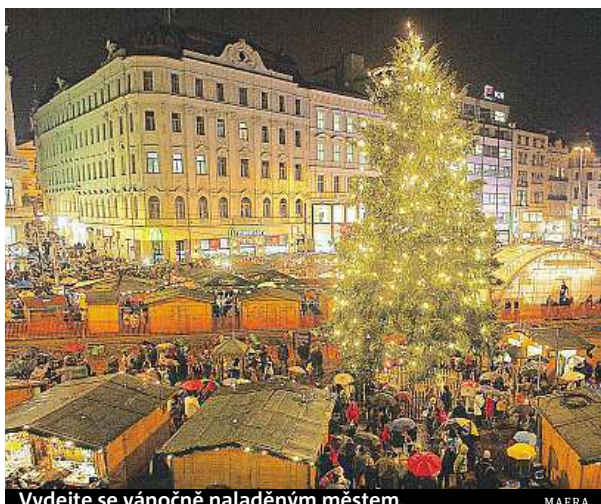
Vydejte se vánočně naladěným městem.

Procházky připravuje již potřetí Turistické a informační centrum Brna. Zájem o ně byl v předchozích letech velký a jinak tomu zřejmě nebude ani letos. „Vánočně vyzdobeným Brnem projdou lidé okolo Staré radnice, kde se budou vyprávět typické pověsti o drakovi či kole, dále Mečovou ulicí, kde je známý zazděný radní a nejužší domy v Brně. Pokračovat se bude na Dominikánské náměstí, kde stojí Nová radnice, a na náměstí Svobody,“ přiblížila trasu procházky Gabriela Pe-