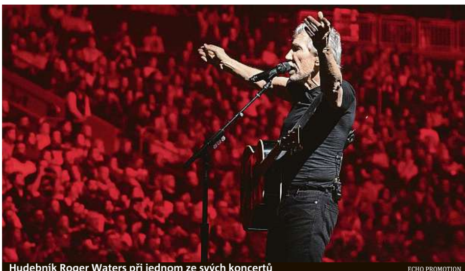
Hudebník Roger Waters při jednom ze svých koncertů

Anglický hudebník, skladatel a zpěvák Waters stál u počátků kultovní kapely Pink Floyd, která od šedesátých let svými hity ovlivňovala prostředí rockové hudby. Sám Waters se v sedmdesátých letech stal hlavním textařem kapely, velký vliv měl i po hudební stránce. Z jeho pera