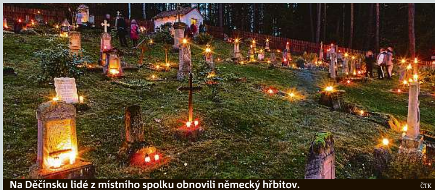
Na Děčínsku lidé z místního spolku obnovili německý hřbitov.