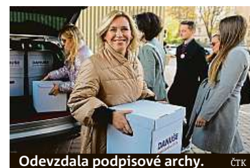
Odevzdala podpisové archy.

Bývalá rektorka Mendelovy univerzity Danuše Nerudová na ministerstvu vnitřní odevzdala přihlášku do prezidentských voleb. Podpisů její tým nasbíral přes 100 tisíc, po kontrole jich odevzdala více než 82 tisíc. Podle Hany Malé z odboru tisku ministerstva úřad v úterý evidoval deset přihlásek do lednových prezidentských voleb. Ministerstvo bude teď kontrolovat náležitosti kandidátních listin. Při sběru podpisů projela celou Českou republiku, řekla. „A trůfám si říct, že znám problémy, které trápí lidi v regionech. A jako prezidentka se zasadím o to, aby se nezapomínalo na regiony, kde se lidem nežije tak dobře jako ve zbytku naší republiky,“ uvedla. Jsou to podle ní oblasti, které dlouhodobě přispívaly k blaho-