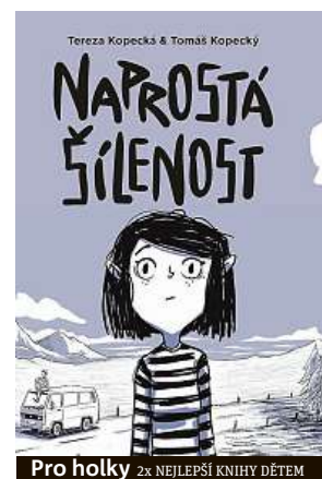
Pro holky 2x NEJLEPŠÍ KNIHY DĚTEM