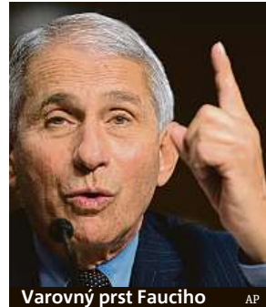
Varovný prst Faucio

Prezident USA Donald Trump včera naznačil, že by v případě svého vítězství ve volbách zřejmě vyhodil ze svého týmu uznávaného epidemiologa Anthonyho Faucioho. Expert se těší v boji s pandemií covidu-19 větší důvěře veřejnosti než Trump. S prezidentem se však v poslední době výrazně rozcházejí v názorech ohledně toho, jak se vypořádat s šířením nákazy. O víkend prezidentovo počínání otevřeně kritizoval v deníku The Washington Post.