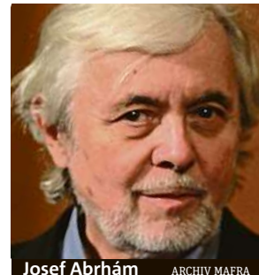
Josef Abrahám

Oblíbený herec, jenž ztvárnil desítky skvělých rolí ve filmu a v divadle, získává Cenu Thálie za celoživotní dílo.