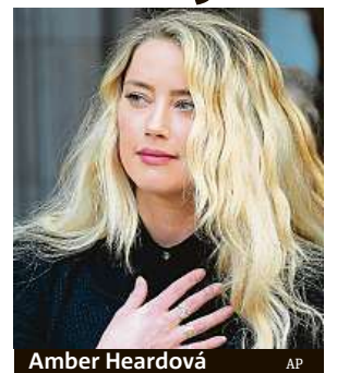
Amber Heardová

Ta se chystá ve Spojených státech představit další důkazy o násilnické povaze herce. Depp podal na Heardovou žalobu kvůli pomluvě, ve které po ní žádá 50 milionů dolarů (1,2 miliardy korun). ČTK