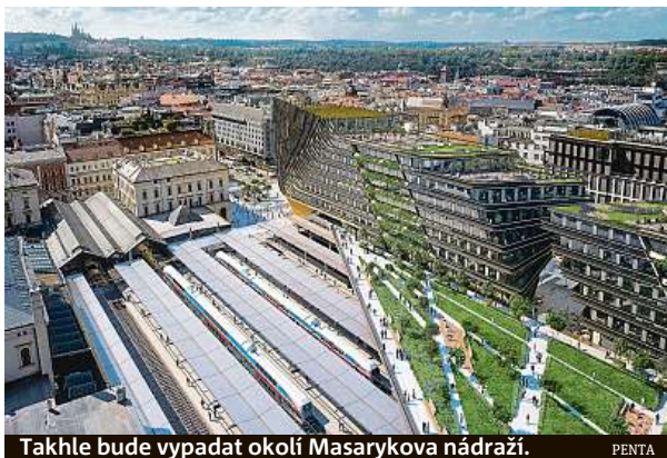
Takhle bude vypadat okolí Masarykova nádraží. PENTA

„Konečně můžeme představit finální podobu budov, ke které jsme dospěli po čtyřech letech diskusí s Institutem plánování a rozvoje, odbornou i laickou veřejností. Diskuse neovlivnila jen vlastní projekt, i když i pro něj byla významná. Snížila se výška budov, proměnilo se jejich členění, vliv měla společen-