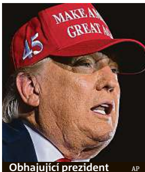
Obhajující prezident AP

Že by názory zkušeného epidemiologa byly jazýčkem na vahách při nynější volbě? Muž, který sloužil v několika prezidentských administrativách, je teď v nemilosti.