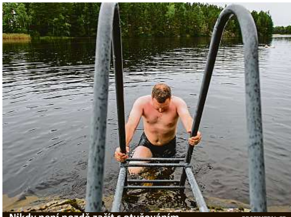
Nikdy není pozdě začít s otužováním.