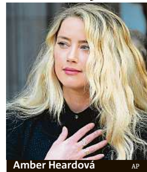
Amber Heardová

Ta se chystá ve Spojených státech představit další důkazy o násilnické povaze herce. Depp podal na Heardovou žalobu kvůli pomluvě, ve které po ní žádá 50 milionů dolarů (1,2 miliardy korun). ČTK