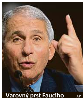
Varovný prst Fauciho

Prezident USA Donald Trump včera naznačil, že by v případě svého vítězství ve volbách zřejmě vyhodil ze svého týmu uznávaného epidemiologa Anthonyho Fauciho. Expert se těší v boji s pandemií covidu-19 větší důvěře veřejnosti než Trump. S prezidentem se však v poslední době výrazně rozchází v názorech ohledně toho, jak se vypořádat s šířením nákazy. O víkend prezidentovo počínání otevřeně kritizoval v deníku The Washington Post.