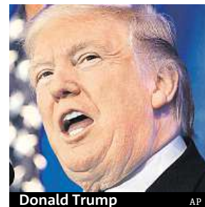
Donald Trump

ta Baracka Obamu vystřídá Clintonová. Její šance vidí na 72,7 procenta, naopak Trump má podle portálu 26,5procentní naději. Clintonová ale za poslední týden výrazně oslabila, z čehož Trump těží. V případě její výhry nemohou sázející počítat s vysokými zisky. Aktuálně