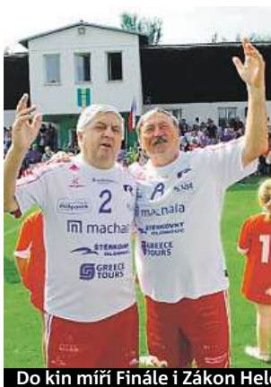
Do kin míří Finále i Zákon Helena.